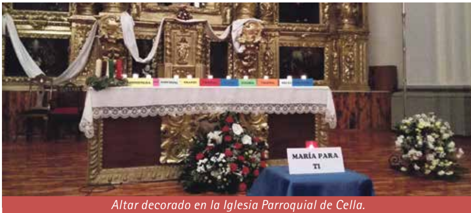
Altar decorado en la Iglesia Parroquial de Cella.

Convocados por Acción Católica General con el lema María, luz en mi vida, el pasado 7 de diciembre nos reunimos para celebrar la Vigilia de la Inmaculada en el marco incomparable de la iglesia parroquial de Cella.