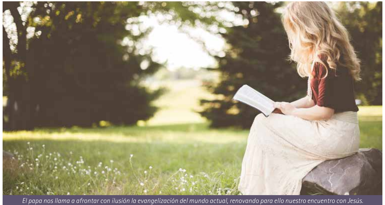
El papa nos llama a afrontar con ilusión la evangelización del mundo actual, renovando para ello nuestro encuentro con Jesús.

Concluimos hoy la presentación del documento «Jesucristo, salvador del hombre y esperanza del mundo». En el cuarto capítulo, los obispos de España presentan el encuentro con Jesucristo Redentor como “principio de renovación de la vida cristiana y meta del anuncio evangélico”. Y añaden, “si no sentimos el deseo de comunicarlo, necesitamos la oración para pedirle que vuelva a cautivarnos”.