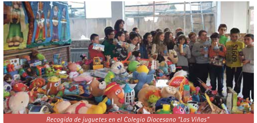
Recogida de juguetes en el Colegio Diocesano "Las Viñas"