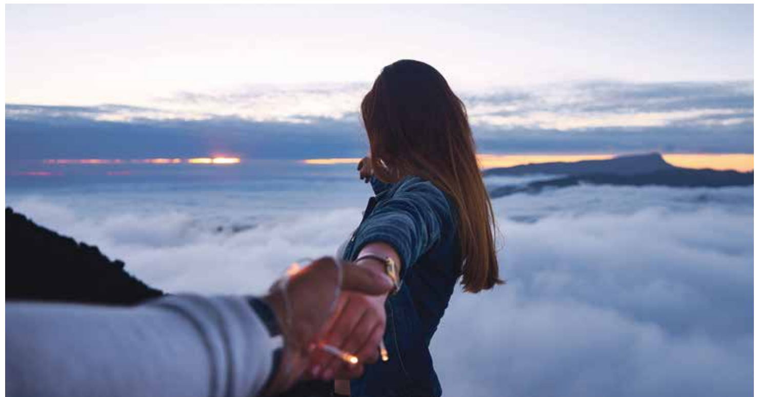
Los Centros de Orientación Familiar buscan soluciones para conseguir una vida familiar más equilibrada.

Este centro realiza la labor de consulta, orientación, prevención y terapia a cuantas familias y personas lo demandan y está abierto de lunes a viernes, en horario de 9.30 a 13.30 por la mañana y de 16.00 a 18.00 por la tarde. Basta llamar al 974 70 24 03 para pedir el día y la hora de la consulta o acudir personalmente al COF Altoaragón, situado en la calle Manuel Ángel Ferrer 2, bajos, de Huesca (detrás de la Parroquia oscense de San José).