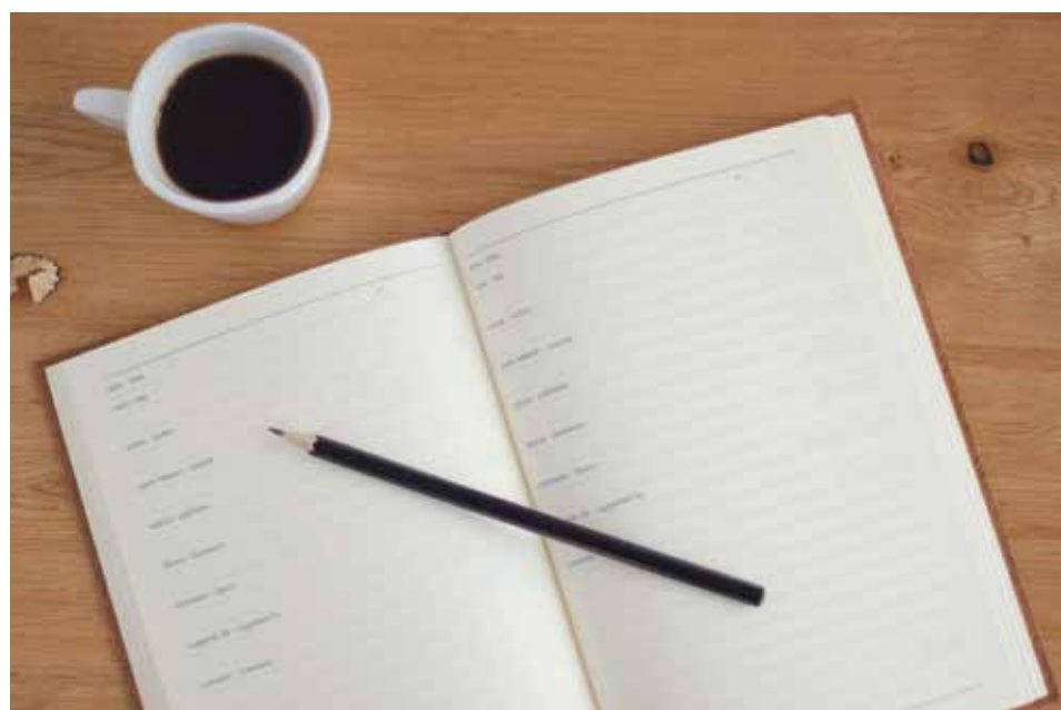
El año que comienza es una oportunidad para plantearse la vida con hondura.

Todos tenemos experiencia de esas listas de propósitos que estrenamos con cada calendario, de los buenos deseos que guardamos en el corazón para cuando los tiempos nos sean favorables. El año que empieza, con tantos días por estrenar, parecería suficientemente amplio para que quepa todo, incluso aquello que solo depende de nosotros y para lo que nunca encontramos tiempo, por más que sea importante.