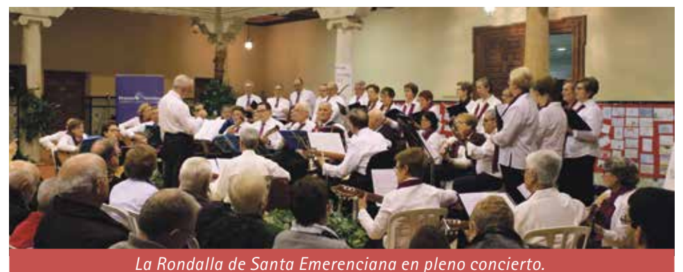
La Rondalla de Santa Emerenciana en pleno concierto.

Con un repertorio variado con canciones tradicionales, jotas y villancicos, la Rondalla de Santa Emerenciana deleitó a los asistentes al concierto solidario que se celebró en el Obispado de Teruel.