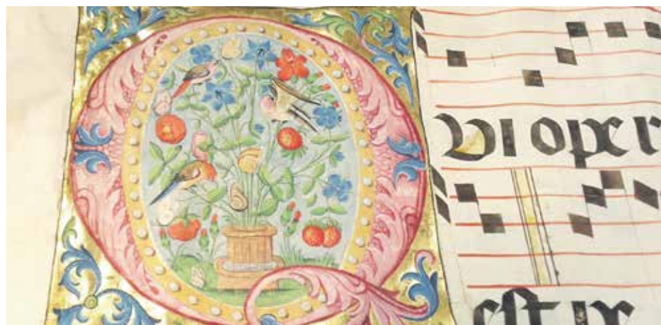
Detalle de los cantoriales con miniaturas flamencas que se expondrán en Huesca.

El Museo Diocesano de Huesca ha desarrollado durante el verano visitas teatralizadas e interactivas por su catedral bajo el título 'Los constructores de Catedrales', con el objetivo de mostrar las vicisitudes de la última fase de obras de la misma, la realización del retablo y las principales dificultades que hubo para levantar el edificio madre de la Diócesis. El museo de Barbastro, por su parte, ha realizado dos exposiciones temporales, 'Año jubilar Escolapio' en julio, y 'El nacimiento de un Reino y una Corona',