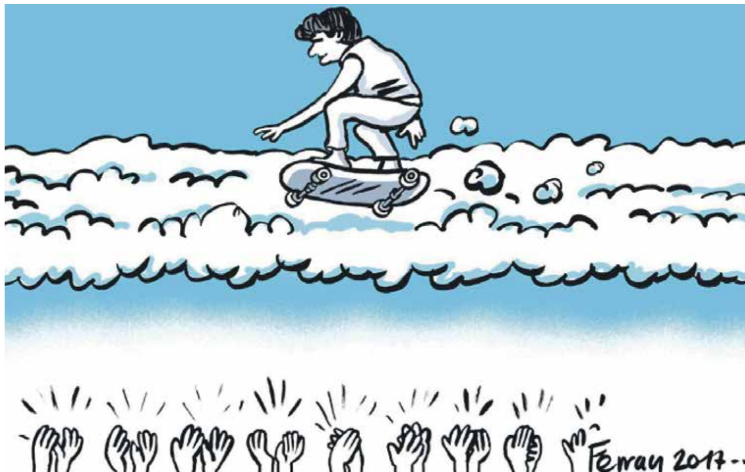
Viñeta de Ferran Martín sobre Ignacio Echeverría, el héroe del monopatín asesinado en Londres el pasado mes de junio.

3) Hay también una tercera vía, menos conocida y menos común, que conduce al mismo resultado