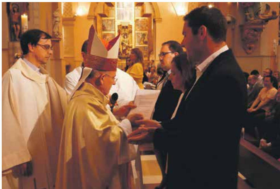
El arzobispo unge las manos de los catecúmenos.

Vivir los sacramentos de la Iglesia es vivir la Pascua de Jesús. El encuentro con Cristo en los sacramentos convierte a las personas en hijos de Dios, hermanos de Jesús y miembros de la Iglesia. La Iglesia diocesana de Zaragoza ha crecido esta Pascua. Una alegría y un renovado compromiso.