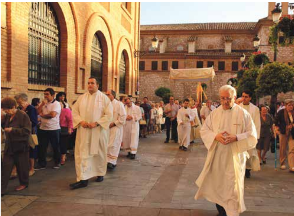
Procesión con el Santísimo en la fiesta del Corazón de Jesús del año 2014.

La asociación del Apostolado de la Oración ha organizado, para el mes de junio, estos actos en honor del Sagrado Corazón de Jesús, en la Iglesia de las Clarisas de Teruel: