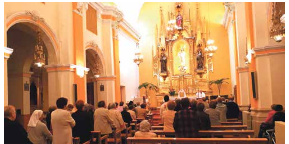
Pascua del Enfermo en la Iglesia de las Clarisas de Teruel.