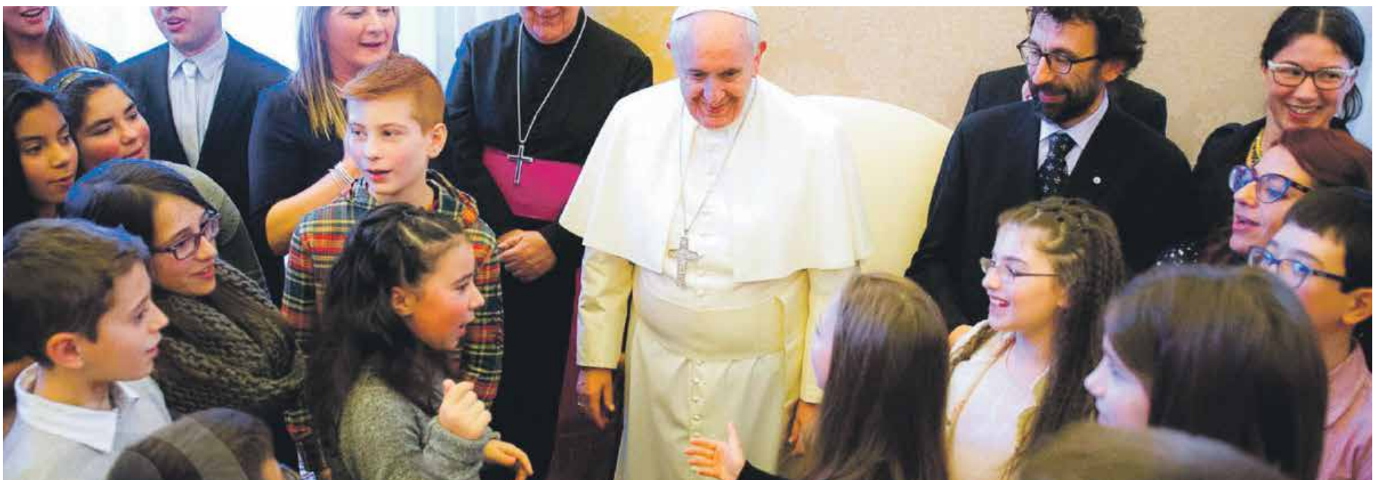
El papa Francisco a la Acción Católica: "Ensanchen su corazón, para ensanchar el corazón de las parroquias".

Navegando por la red, me he encontrado con un sucedido y, aunque no he podido contrastar la autenticidad del diálogo, me ha parecido oportuno transcribirlo, porque incluso como ficción tiene mucho sentido. Dice así: "Hallándose cierto día el papa san Pío X entre un grupo de cardenales, les preguntó: -¿Qué os parece lo más urgente hoy para salvar a la sociedad? -Edificar escuelas, contestó uno. -No, replicó el papa. -Multiplicar las iglesias, añadió otro. -Tampoco. -Reclutar más clero, dijo un tercero. -Ni eso siquiera, repuso el papa. No. Lo más urgente ahora es tener en cada parroquia un núcleo de seglares virtuosos, y, al mismo tiempo, ilustrados, esforzados y verdaderos apóstoles".