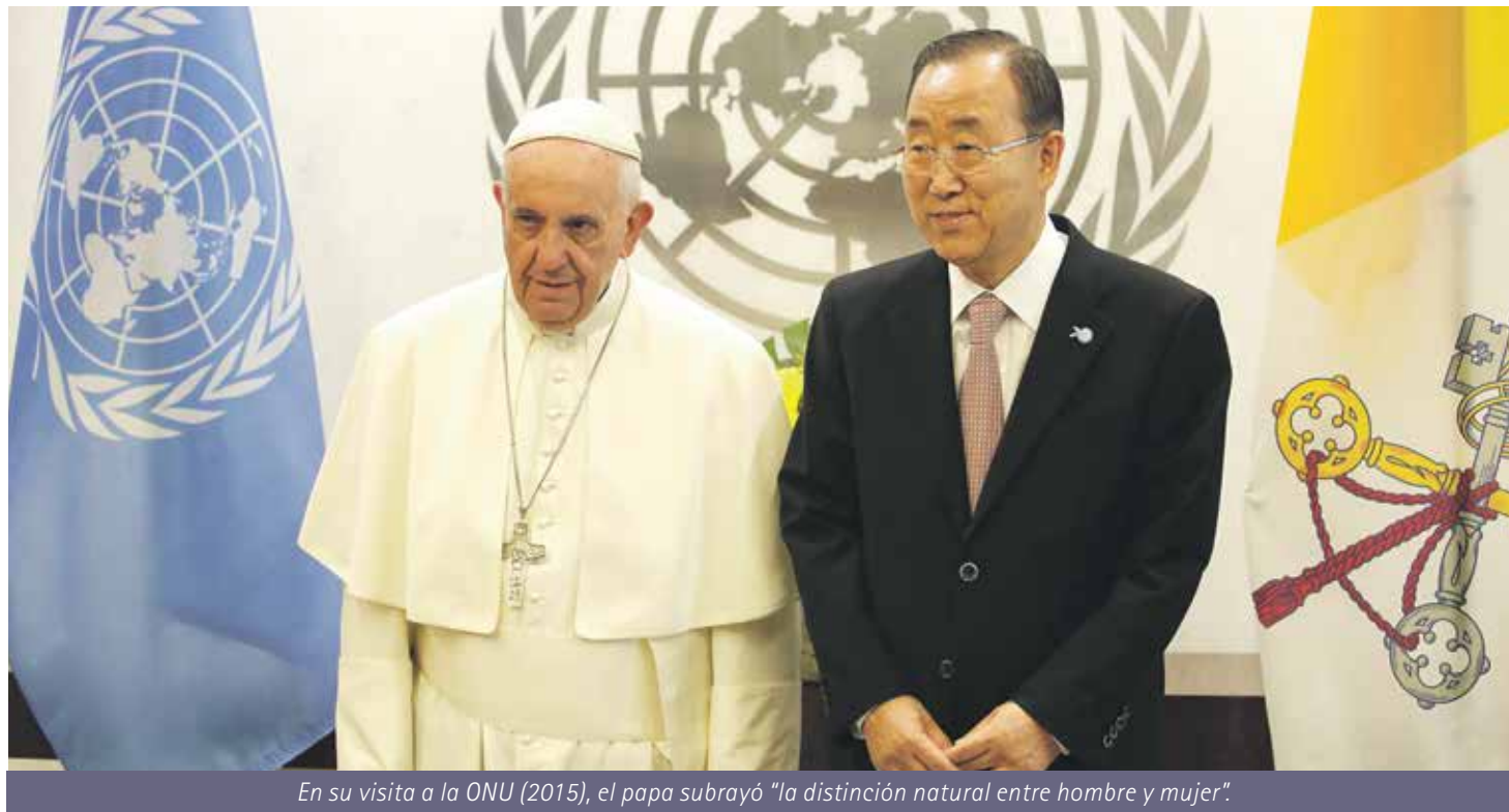
En su visita a la ONU (2015), el papa subrayó "la distinción natural entre hombre y mujer".

Habló de muchas cosas y muchas veces. De la 'ideología de género' solo lo hizo una vez, sin embargo su denuncia ante la "colonización ideológica" para imponer la 'teoría del gender ' ocupó los titulares periodísticos. 'Iglesia en Aragón' quiere explicar en qué consiste esta ideología que campa a sus anchas por las series de televisión, las concejalías de igualdad y las aulas de nuestras escuelas.