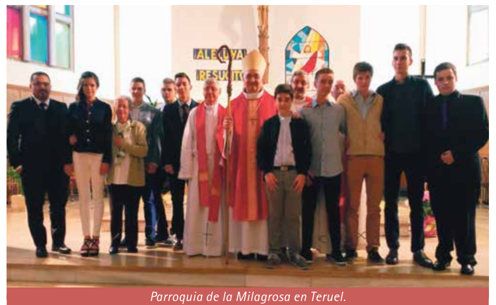
Parroquia de la Milagrosa en Teruel.