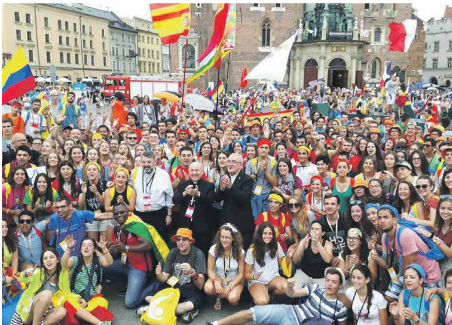
El arzobispo de Zaragoza y los obispos de Calahorra y Barbastro-Monzón con los jóvenes en la JMJ de Cracovia, el verano pasado.

Una nueva iniciativa, lanzada el año pasado en la diócesis, son las 'Noches Claras'. Se celebran un viernes de cada mes, y es un rato de oración y encuentro con Dios, especialmente pensado para jóvenes, y apoyado de experiencias, música, textos, representaciones teatrales... Para mi, personalmente (de igual modo