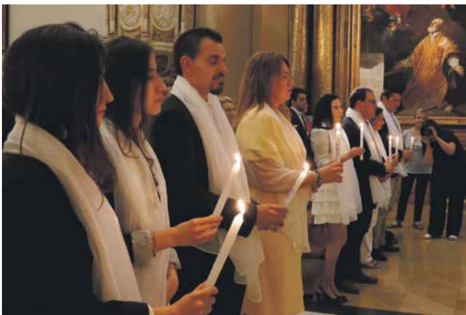
Los neófitos sostienen el signo de la luz tras recibir las aguas bautismales.