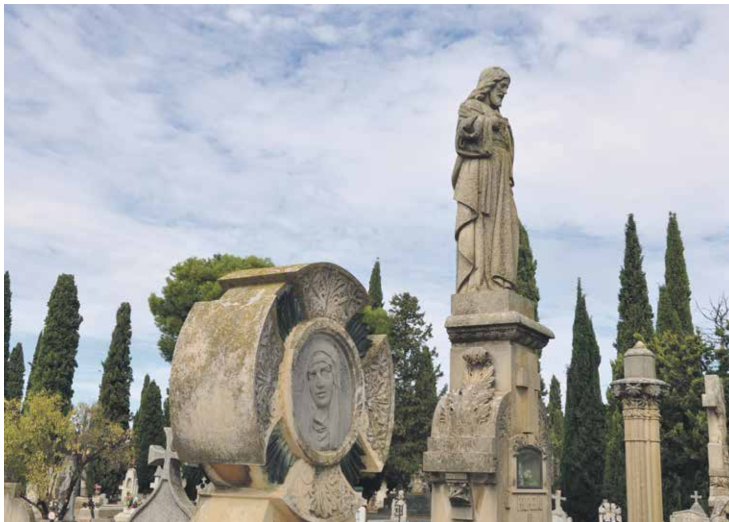
Cristo resucitará a todos en el último día, con un cuerpo incorruptible.

El credo apostólico o ‘Símbolo de los Apóstoles’ es una fórmula con la que la Iglesia, desde sus orígenes, ha expresado sintéticamente la propia fe, y la ha transmitido con un lenguaje común y normativo para todos los fieles. Benedicto XVI, al comienzo del ‘Año de la Fe’, invitaba a que “el Credo sea mejor conocido, entendido yorado”. Lo hacía convencido de que, además de ser clave clave para la conversión personal, es el mejor antídoto ante el relativismo y el subjetivismo, males de nuestra sociedad que también afectan al pueblo de Dios.