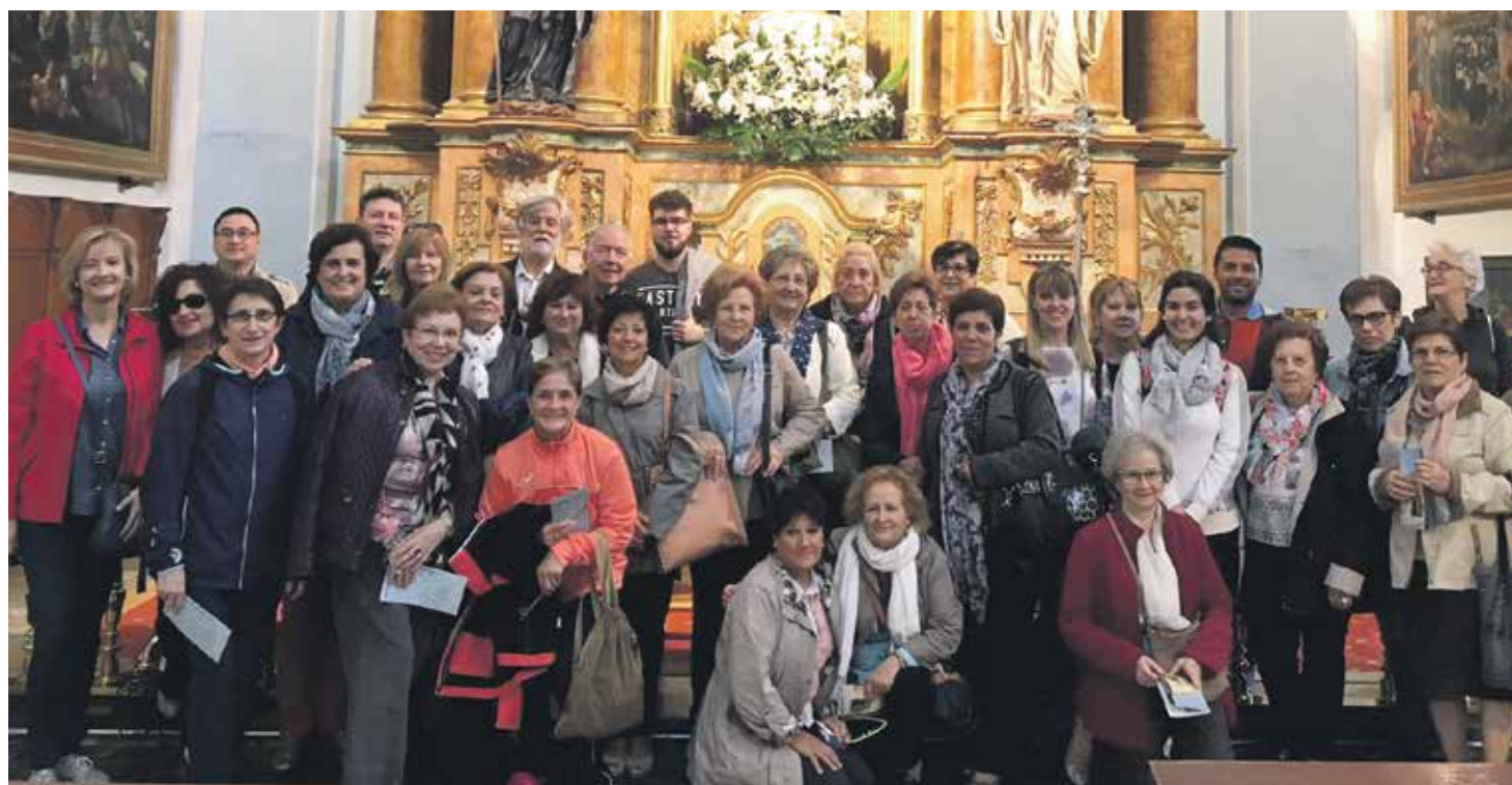
Catequistas y sacerdotes de todos los rincones de Aragón acudieron al encuentro, que superó las expectativas de afluencia.

El pasado 21 de octubre, todas las diócesis de Aragón celebramos, un año más, el Encuentro Regional de Catequistas. Este año, la diócesis anfitriona ha sido Zaragoza y la organización del evento corrió a cargo de la Unidad Pastoral de los arciprestazgos de Gallur y Ejea de los Caballeros. El encuentro tuvo lugar en las villas de Ejea y Tauste con gran alegría.