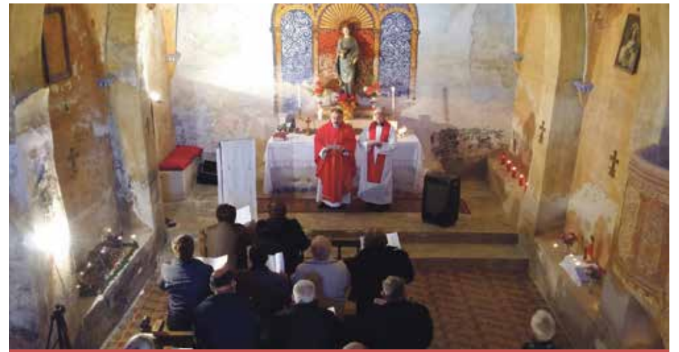
Celebración en la Ermita de Santa Lucía de Josa.

El pasado 13 de diciembre de 2016 el pueblo de Josa celebró la fiesta de Santa Lucía, que junto con San Roque, son los patronos de la localidad. Antiguamente, la fiesta mayor por excelencia era la de Santa Lucía, pues la de San Roque, 16 de agosto, al coincidir con la siega y la trilla, sólo podía celebrarse de forma fugaz. Ahora, pasa todo lo contrario: al descender drásticamente la población de Josa, la de verano se celebra con gran pompa coincidiendo con las vacaciones de la gran mayoría de los que viven fuera del pueblo. Ahora la de invierno se celebra casi de forma simbólica.