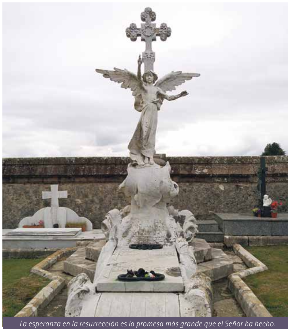
La esperanza en la resurrección es la promesa más grande que el Señor ha hecho.

Dicha Instrucción, Ad resurgendum cum Christo , comienza haciendo referencia a un documento anterior: la Instrucción Piam et constantem , emitida el 5 de julio de 1963 por el entonces Santo Oficio, y donde se subrayaba la importancia y la viva recomendación de seguir practicando «la piadosa costumbre de sepultar el cadáver de los difuntos», al tiempo que se decía que la cremación no es «contraria a ninguna verdad natural o sobrenatural». Se habló, pues, del tema hace más de cincuenta años, debido a que, por diversas razones, empezaba a ser costumbre quemar o incinerar a los difuntos. La única traba que en esta Instrucción se ponía a la práctica de la cremación era que la cremación no debía obedecer en ningún caso a la «negación de los dogmas cristianos», ni proceder del «odio contra la