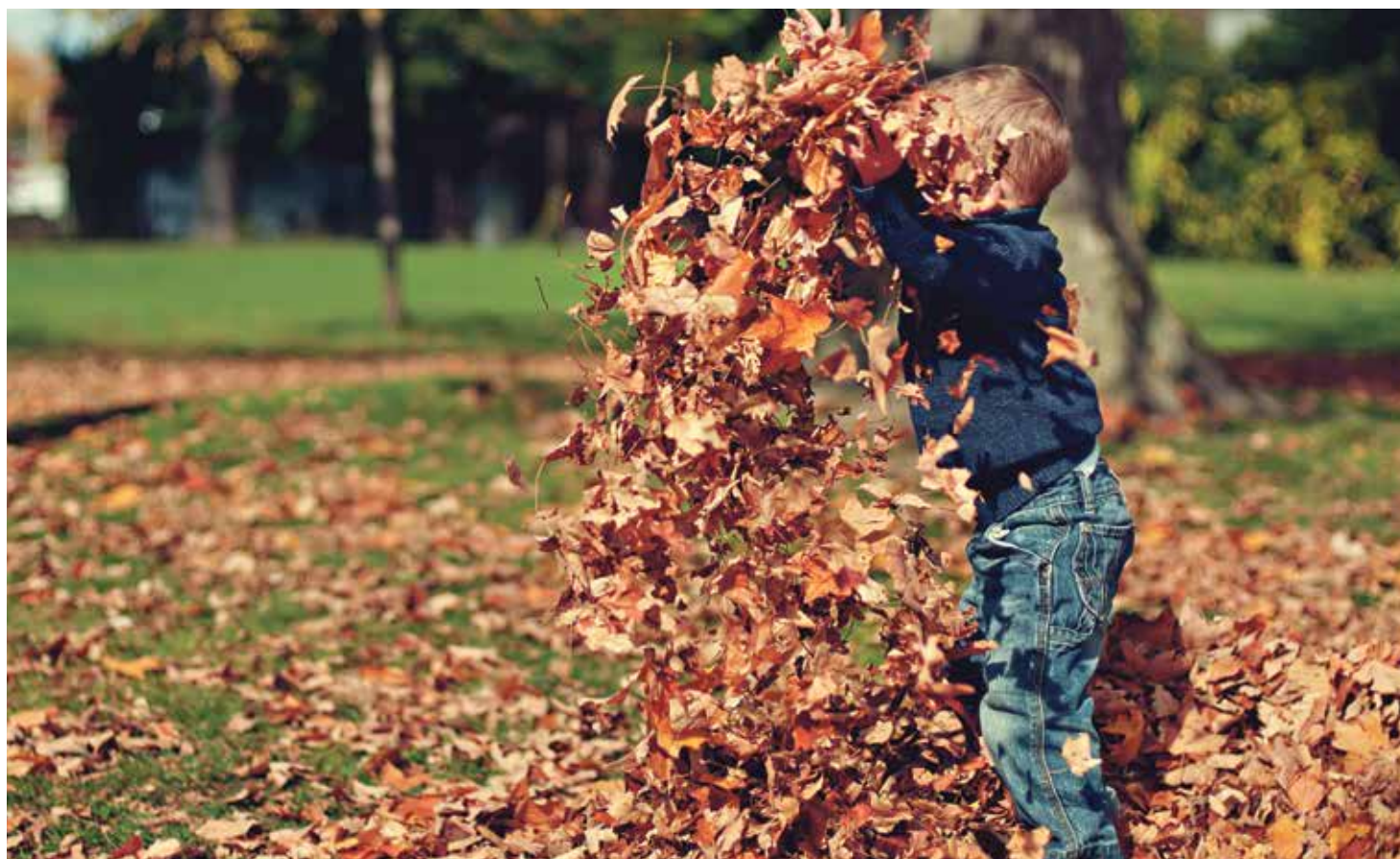
Los niños tienen que gozar de los medios necesarios para desarrollar su personalidad con esplendor.

Una preocupación especial suponen las niñas víctimas de trata con fines de explotación sexual: unas 45.000, recoge un informe de la organización Save the Children, que alerta también de los niños que viajan sin nadie que les cuide -menores extranjeros