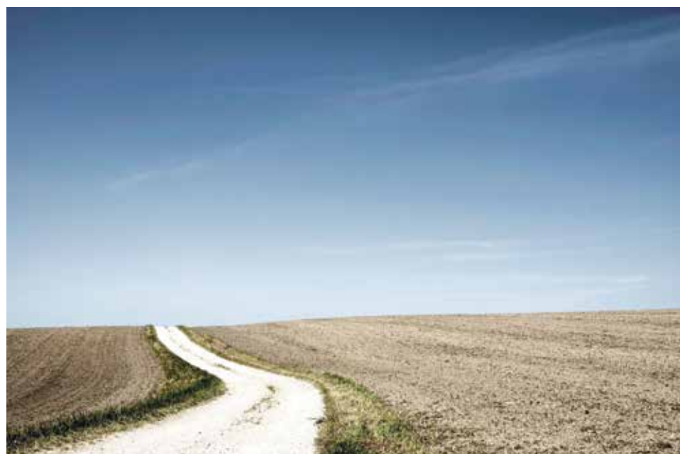
Cada ser humano tiene su camino para canalizar la experiencia íntima con Dios.