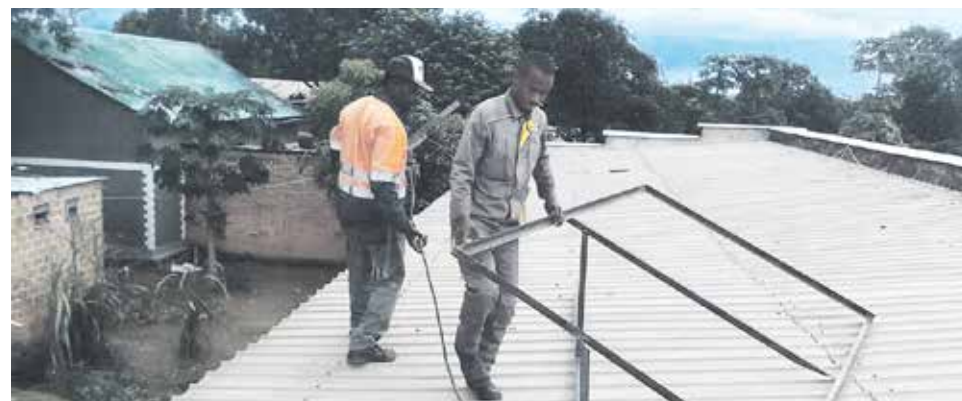
Proyectos financiados por la Delegación de Misiones

La Delegación Diocesana de Misiones, gracias a los donativos recibidos de nuestros colaboradores, ha financiado los siguientes Proyectos, que han sido solicitados por misioneros diocesanos: