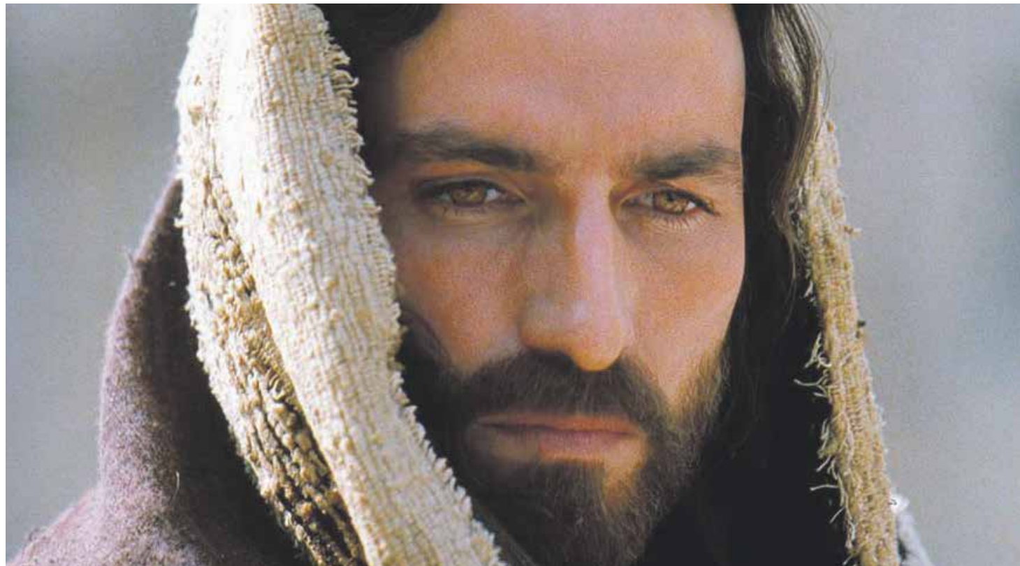
El cine confronta al hombre con las grandes preguntas de la vida.

Cuando llega la Semana Santa, tenemos la oportunidad de ver en la televisión numerosas películas sobre la vida de Jesucristo, así como otras obras que abordan temas bíblicos. Es en ese momento cuando surge el tópico de que la "pequeña pantalla" se inunda de algo conocido como "cine religioso". Pero, ¿qué podemos entender por "cine religioso"? ¿Qué tipo de historias aborda? ¿Es un cine para creyentes o se dirige a un público heterogéneo en busca de respuestas?