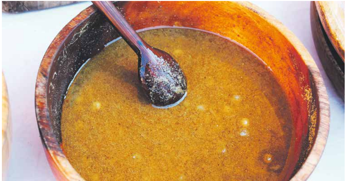
El ayuno de Viernes Santo permite una comida, que bien pudiera ser el típico potaje con legumbre, verdura y bacalao.

Los pucheros no se separan mucho de la religión, como lo demuestra que, en muchos recetarios, el tiempo de cocción se mide por los segundos de rezar alguna oración.