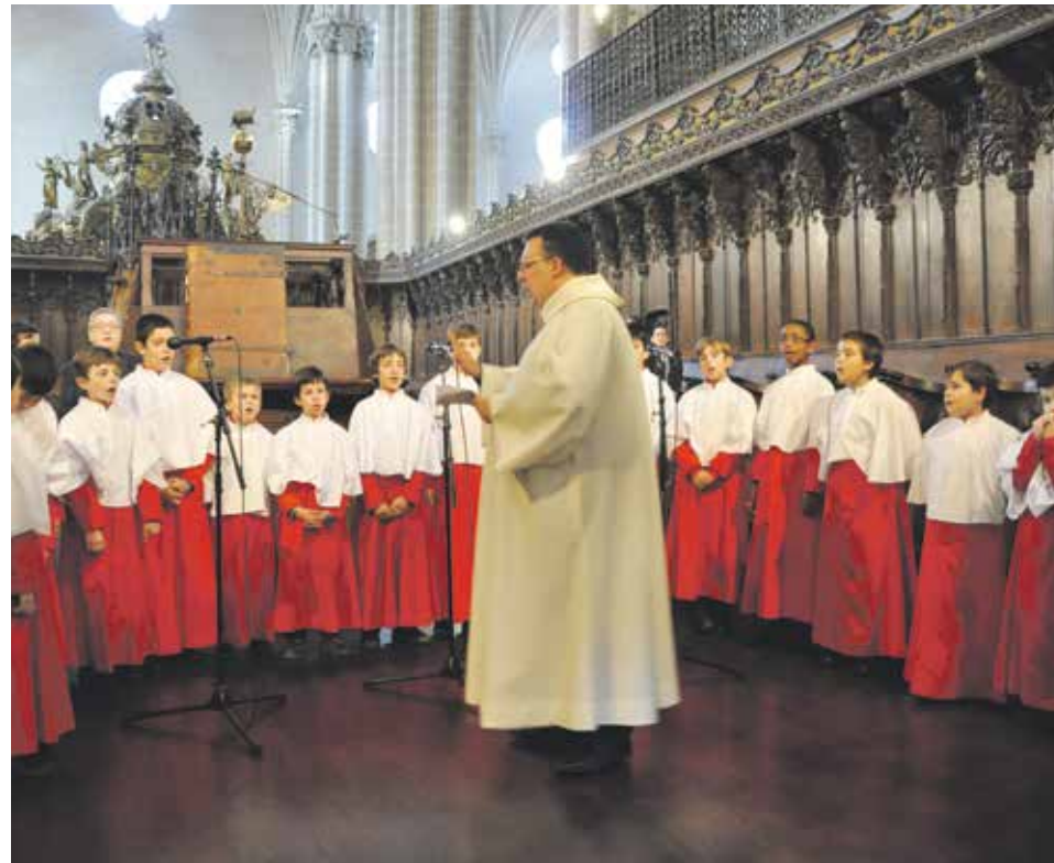
La música es parte integrante de las celebraciones litúrgicas y devocionales.

Una de las prácticas de piedad más extendidas en Cuaresma y Semana Santa es el Vía Crucis, el Camino de la Cruz; la meditación del recorrido que hizo Jesús hacia el Calvario para nuestra salvación. Lo realizamos en nuestras parroquias y comunidades, en nuestras hermandades y cofradías... ¿Te animas a hacerlo inspirado con canciones de música cristiana contemporánea?