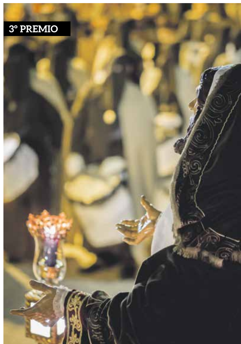
'Despojando el atardecer', de Allende Lores