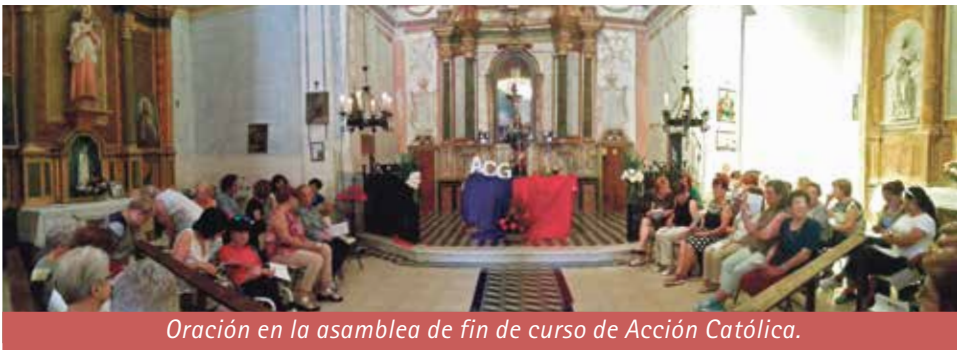
Oración en la asamblea de fin de curso de Acción Católica.

"Todo tiempo tiene su afán. El invierno y el verano, el trabajo y el descanso, los esfuerzos y el reposo, la pasión y la calma, el deseo y los proyectos."