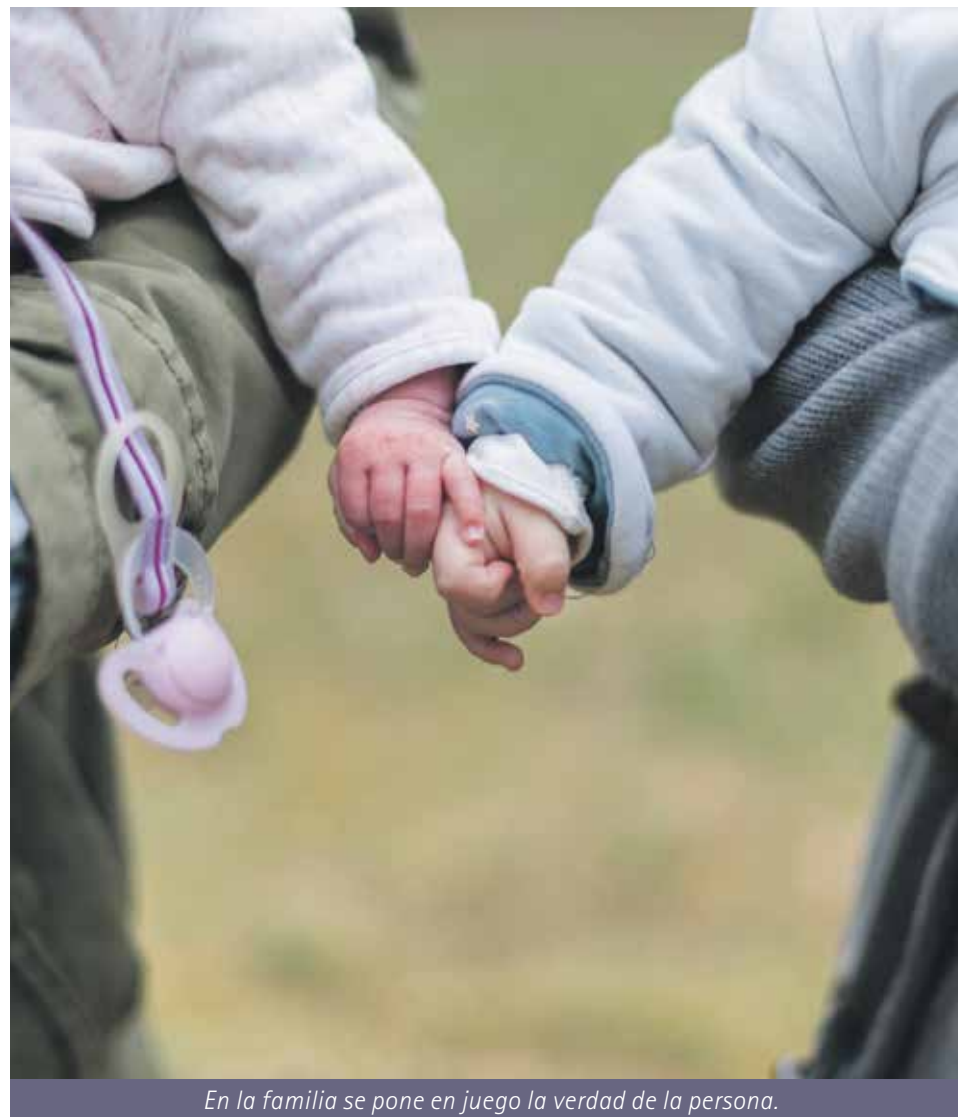
En la familia se pone en juego la verdad de la persona.

Si podemos decir que la persona humana no se realiza en la violencia, ni el desorden afectivo o que existen unos derechos humanos, es porque existe una verdad de fondo en el