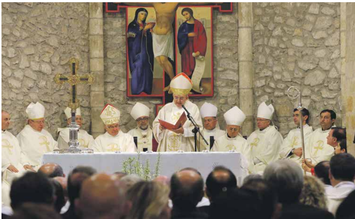
En la apertura del Año Santo Lebaniego estuvo presente el arzobispo de Zaragoza.

Dos trozos de la 'Vera Cruz', la verdadera cruz en la que Jesucristo consumó su ofrenda al Padre, meta de peregrinación y razón para celebrar en 2017 sendos años jubilaes. En Liébana se celebra desde la Edad Moderna los años en que el 16 de abril, festividad de Santo Toribio, cae en domingo. En Caravaca, cada siete años desde 2013.