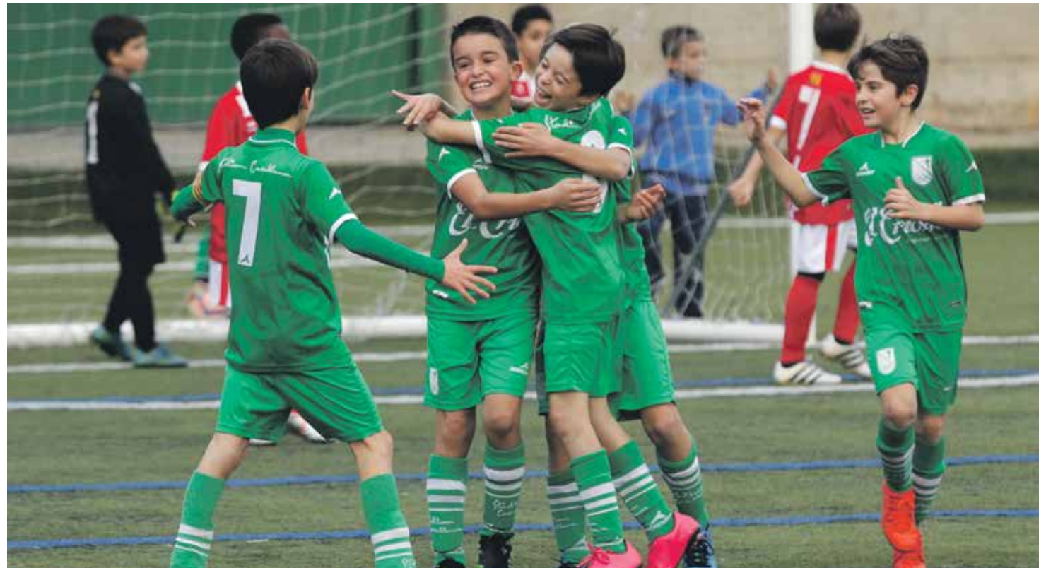
Fomentar los valores cristianos a través del deporte es la prioridad de los técnicos, por encima de los resultados.