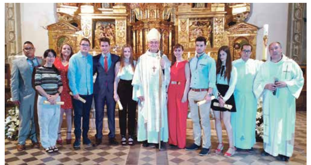
Confirmaciones en la ciudad de Albarracín.