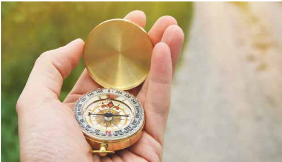
Ejercicios Espirituales en Teruel, del 27 de agosto al 1 de septiembre.

Los ejercicios espirituales de verano para laicos, sacerdotes, religiosas y religiosos son una actividad que cada año organiza la Acción Católica General de Teruel y Albarracín.