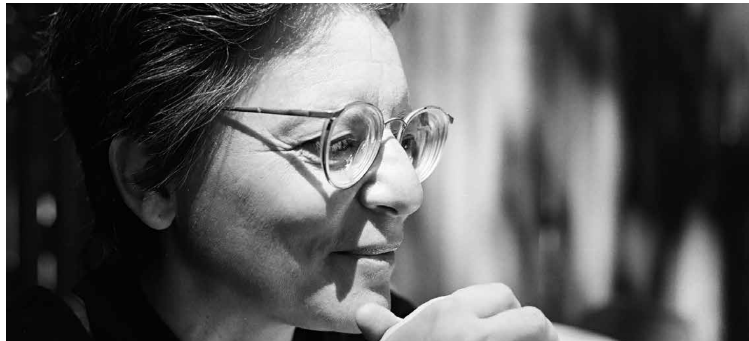
La feminista Shulamith Firestone postula "que las mujeres queden libres de la tiranía de la reproducción por todos los medios posibles".

Este planteamiento de la 'Escuela de Frankfurt' se ha llamado 'Socialismo