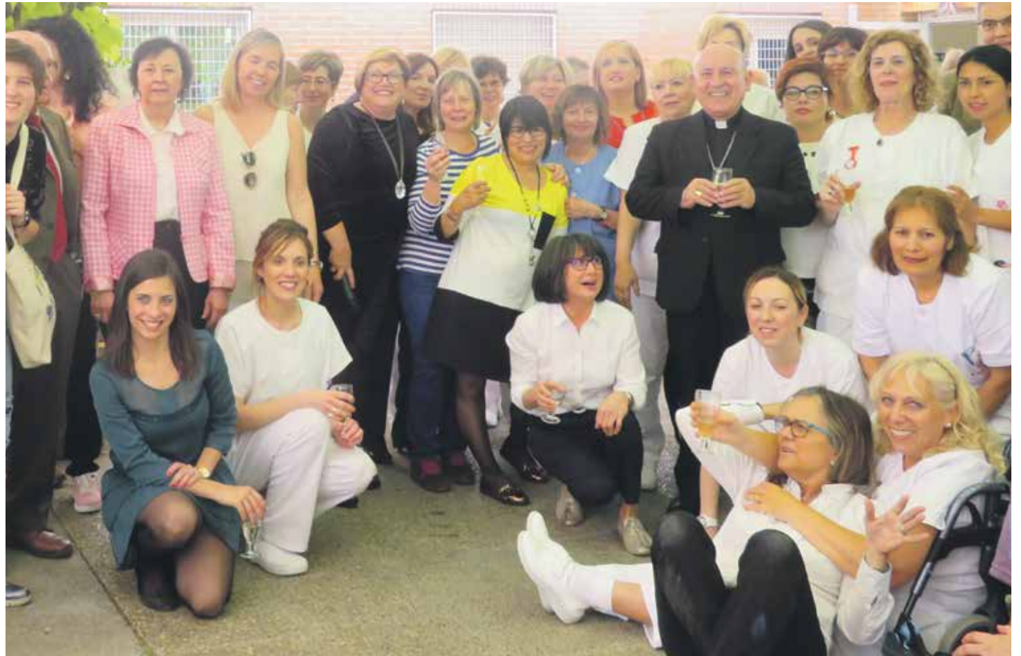
La residencia Santa Teresa, iniciativa de Cáritas en Zaragoza, está celebrando 25 años de asistencia a personas dependientes.

En unas jornadas recientes de las Cáritas de España se abordaba el reto de conseguir un modelo distinto de economía que se centre en la persona y no en el exclusivo beneficio de unos pocos. Una economía solidaria al servicio de los derechos humanos y el cuidado de la Creación. Desde el 2008 han empeorado las condiciones de vida de muchos: escenarios precarios, con condiciones laborales que antes de la crisis resultaban inadmisibles. Como dice el papa, hay que apostar por una economía que no mate a las personas.