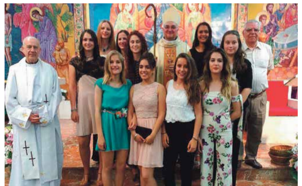
Parroquia de San José en Teruel.