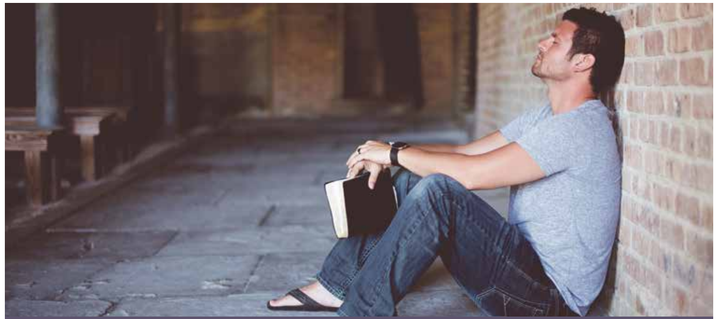
"Es hora de que el sacramento de la reconciliación recobre el puesto central que le corresponde en la vida cristiana".

El encuentro de Jesús –la Misericordia– con aquella mujer adúltera –la mísera– la convirtió en una persona nueva. Nuestras comunidades cristianas no son las mismas tras la experiencia de este Jubileo. Por eso, continúan muchas de sus iniciativas. A continuación presentamos las propuestas del papa Francisco