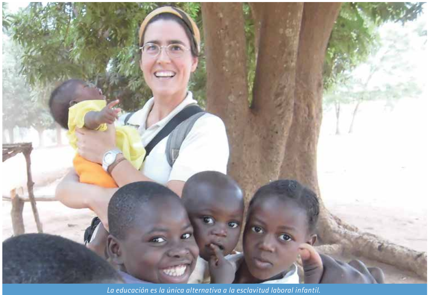
La educación es la única alternativa a la esclavitud laboral infantil.

Manos Unidas denuncia que un tercio de nuestros alimentos acaba en la basura; mientras que 800 millones de personas siguen pasando hambre en el mundo. Ante estas cifras, hace hincapié en tres cuestiones esenciales y urgentes para acabar con el hambre en el mundo: el desperdicio de alimentos, la lucha contra la especulación alimentaria y el compromiso con una agricultura respetuosa con el medio ambiente que asegure el consumo local.