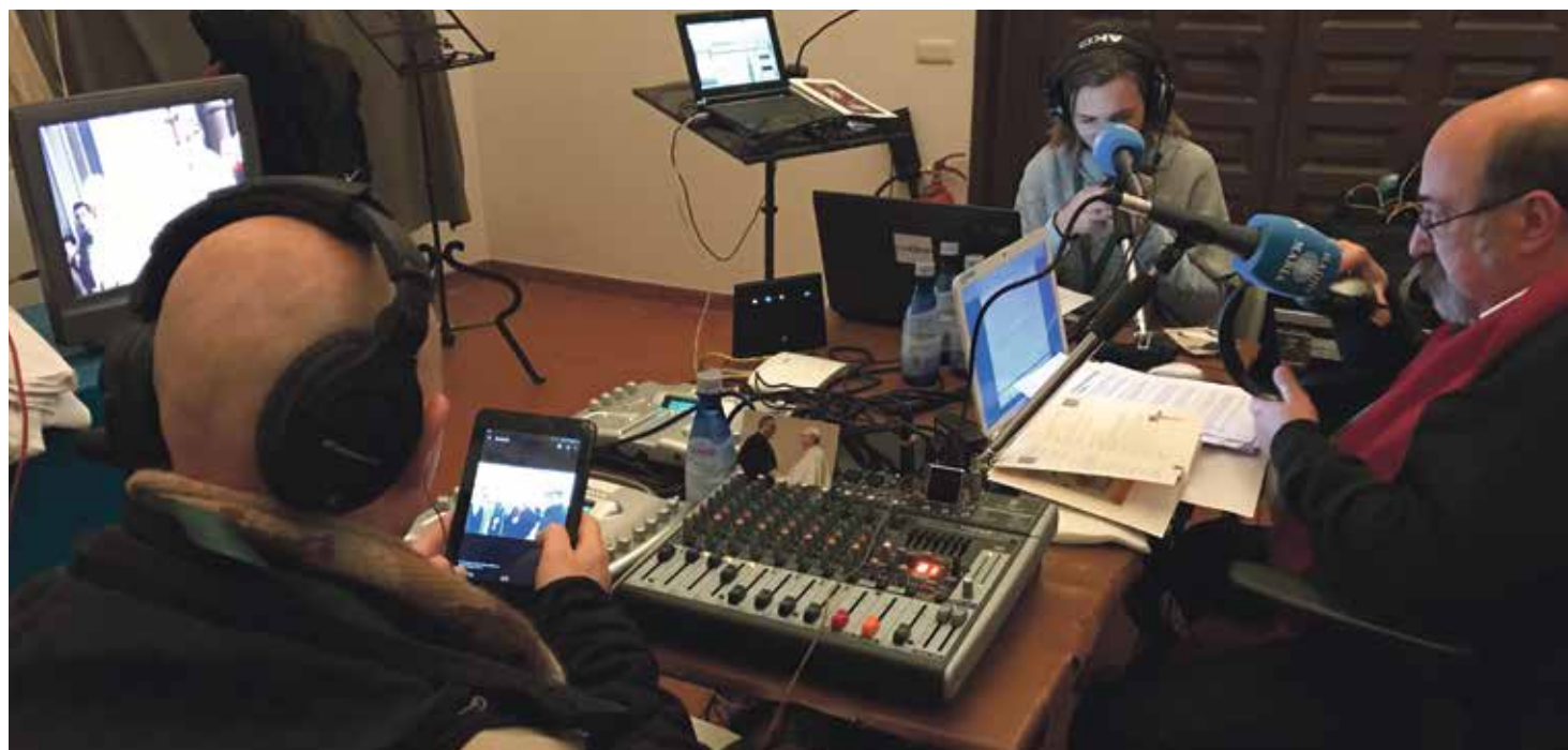
Un equipo de voluntarios de Radio María, en la ordenación del nuevo obispo de Teruel y Albarracín, don Antonio Gómez Cantero.

En Aragón se puede escuchar en casi todos los lugares de nuestra geografía, en FM, TDT, internet, aplicación de móvil... Y hay grupos de voluntarios en casi todas las diócesis aragonesas: Tarazona (Calatayud), Barbastro-Monzón, Huesca, Teruel-Albarracín y Zaragoza. "Los voluntarios colaboran a través de la difusión de la radio en cada provincia, realizan diversas retransmisiones desde parroquias, hospitales, colegios,