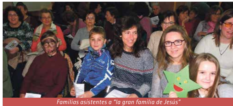
Familias asistentes a "la gran familia de Jesús"