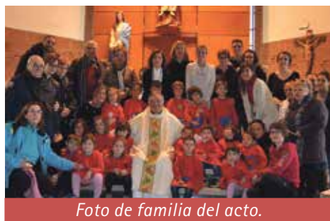
Foto de familia del acto.

El día de "La Candelaria" se va consolidando como una ceremonia "de arraigo" en la ciudad de Teruel. Como hiciera un día María con Jesús, se presentan a Dios a los niños más pequeños y se ponen bajo su protección.