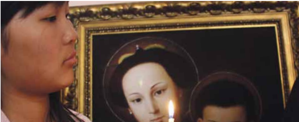
Cristiana originaria de Fochou (China) ante la pila bautismal de S. Joaquín Royo