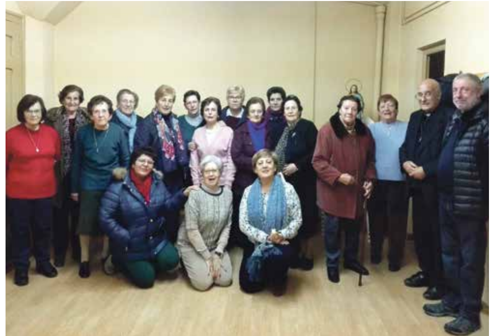
Participantes en el Encuentro de Oración en Villalba Baja

En respuesta a la convocatoria de Acción Católica General nos reunimos en Villalba Baja, el viernes 24 de febrero, para participar en la oración que llevaba por título: Cuaresma. Tiempo de conversión en el camino hacia la Pascua.