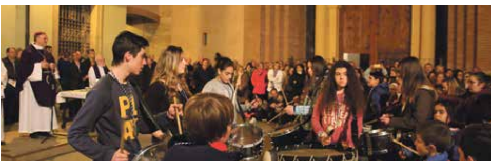
Imposición de la ceniza a las cuadrillas de bombos, tambores y cornetas

El día 1 de marzo, miércoles, se inició el camino hacia la Pascua con el signo y el gesto de la imposición de la Ceniza.