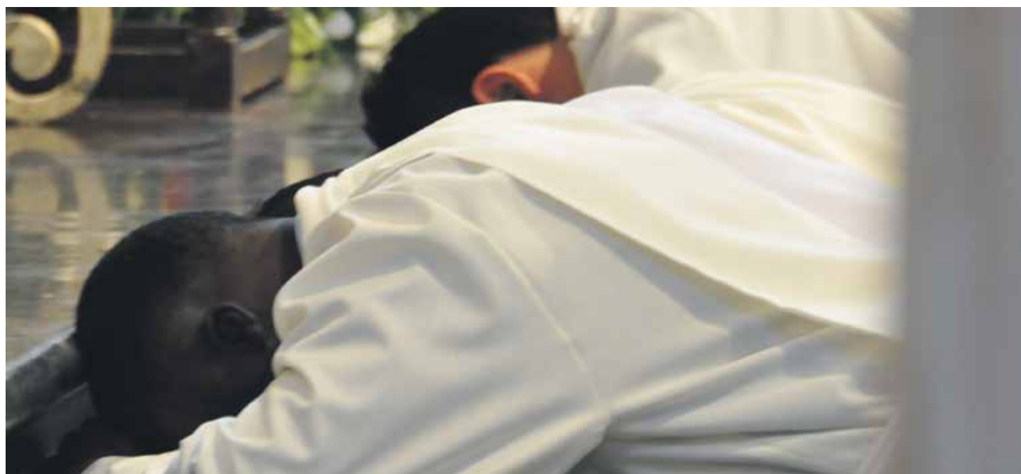
Ordenaciones sacerdotales en la catedral de Nuestra Señora del Pilar de Zaragoza.

Más de doscientas páginas que muestran la continuidad y la novedad necesarias para formar a los seminaristas.