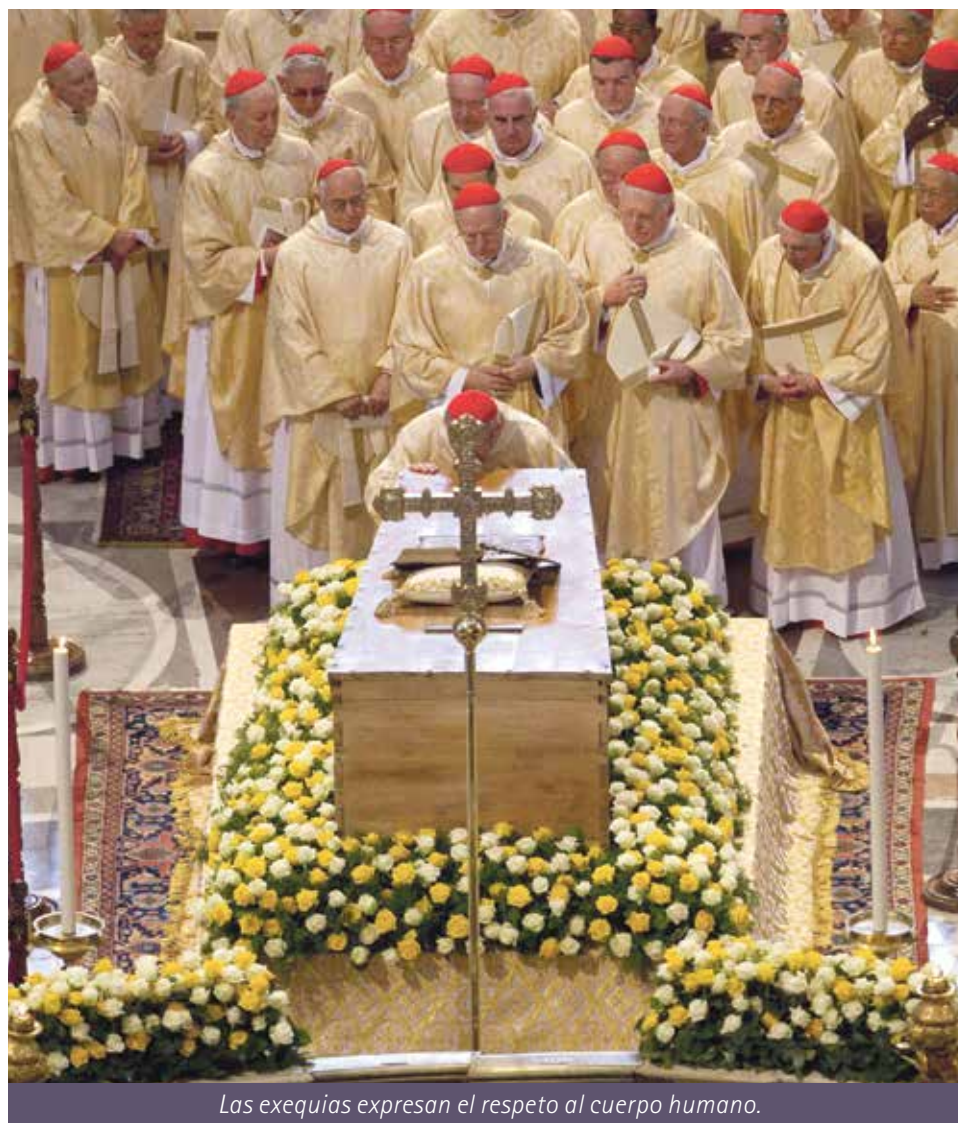
Las exequias expresan el respeto al cuerpo humano.