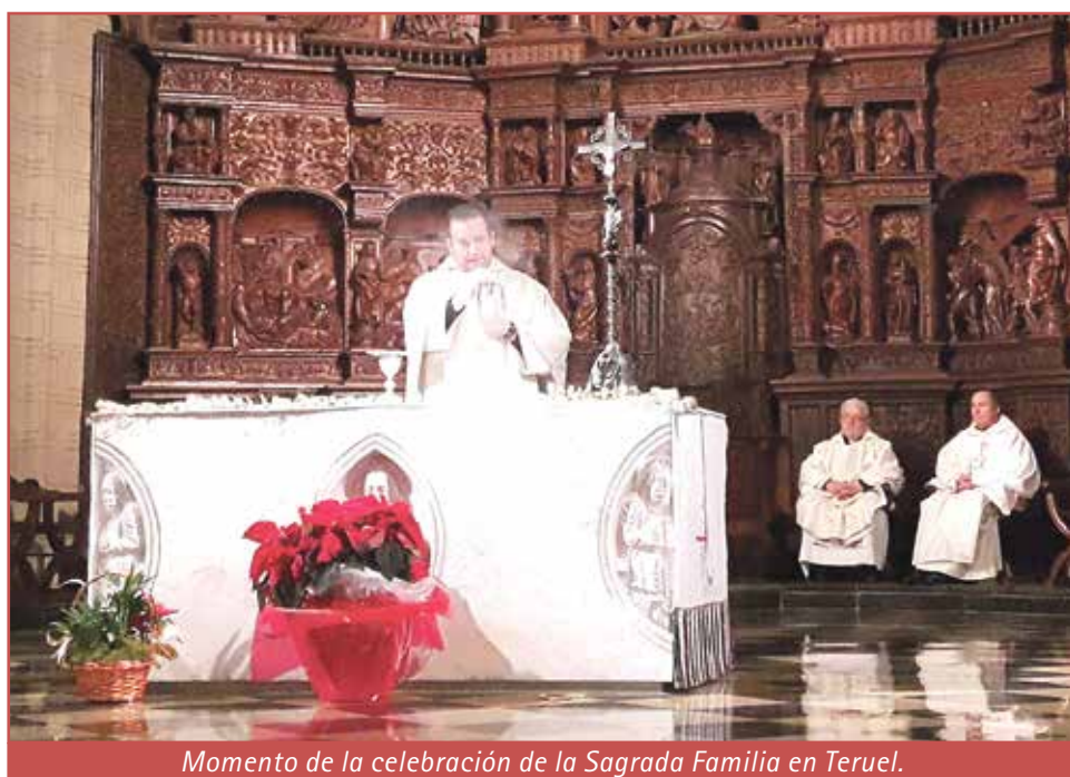
Momento de la celebración de la Sagrada Familia en Teruel.