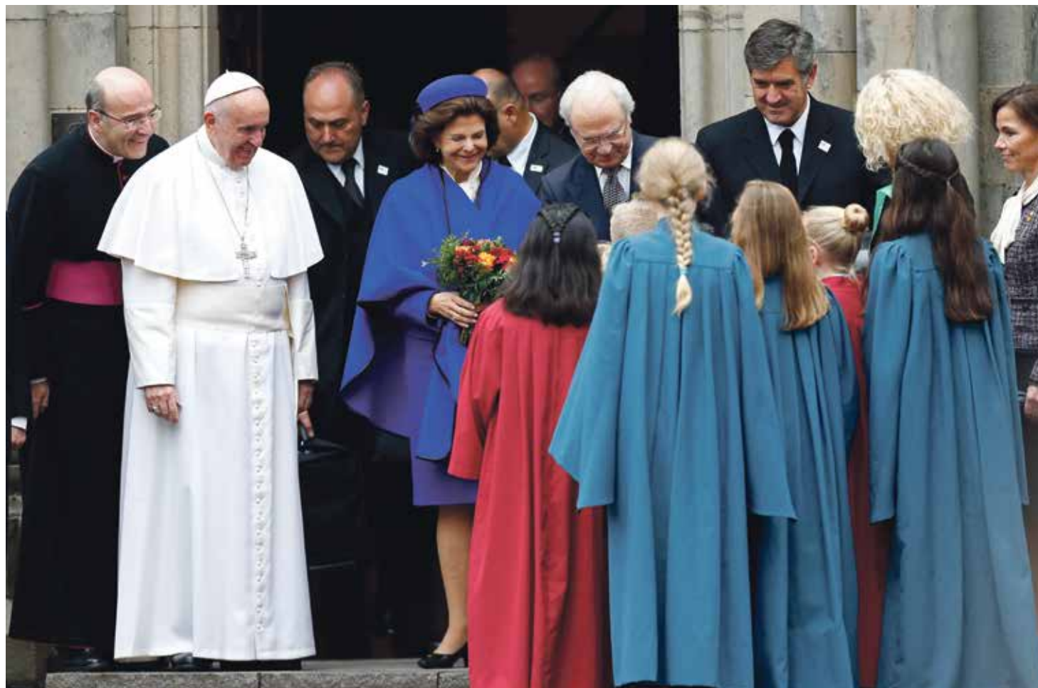
El papa Francisco y los reyes de Suecia durante el inicio de las celebraciones por el 500 Aniversario de la Reforma Protestante.

Siglo XVI. Había ansias de reforma. Muchos intentaban conseguir que la Iglesia occidental se renovara. A un lado, Lutero, Zuinglio, Calvino. Al otro, muchos que permanecieron católicos, como san Ignacio de Loyola, san Francisco de Sales o san Carlos Borromeo. Sin embargo, lo que debería haber sido una historia de la gracia, estuvo marcada por el pecado de los hombres y se volvió una historia del desgarramiento de la unidad del pueblo de Dios. De la mano del pecado y de un modo creciente, vinieron las guerras, la hostilidad mutua y la sospecha.