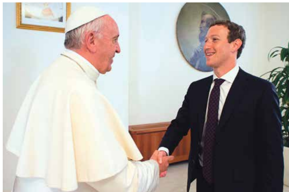
El papa Francisco se reunió con Mark Zuckerberg el pasado mes de agosto.

Desde entonces, el mensaje ha obtenido miles de "likes" y ha sido replicado por numerosos medios de comunicación. Este mensaje llega después de la visita