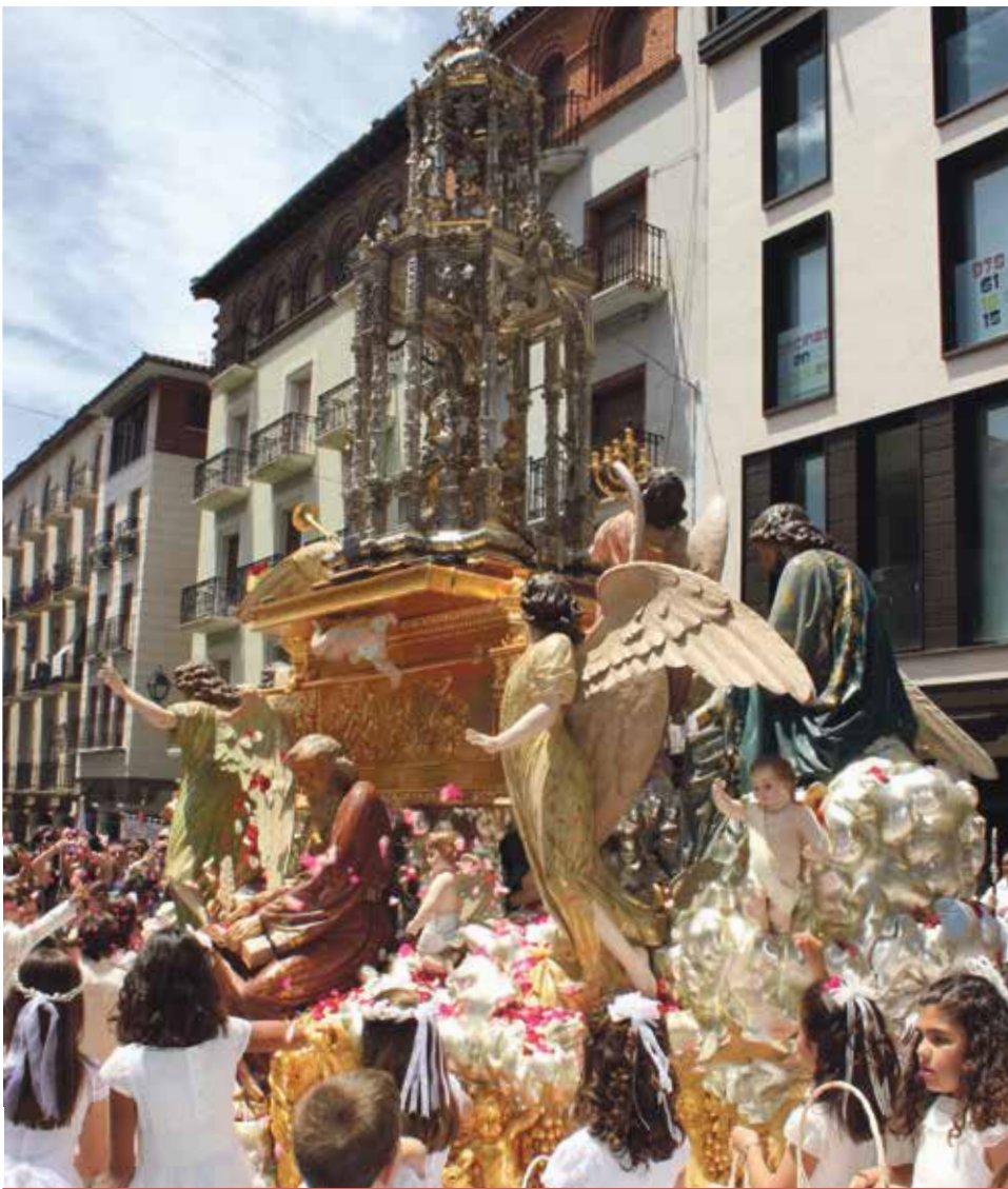
Celebración del Corpus en la Plaza del Torico de Teruel.