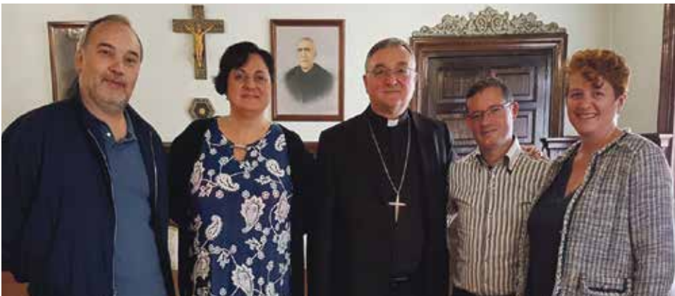
Reunión con el Sr. Obispo en el salón azul.

En la mañana del 5 de junio, nuestro Obispo recibió, en el salón azul del palacio episcopal, a representantes del Programa Sepas, Separados y Divorciados católicos del Centro Arrupe de Valencia. Con gran interés les ha