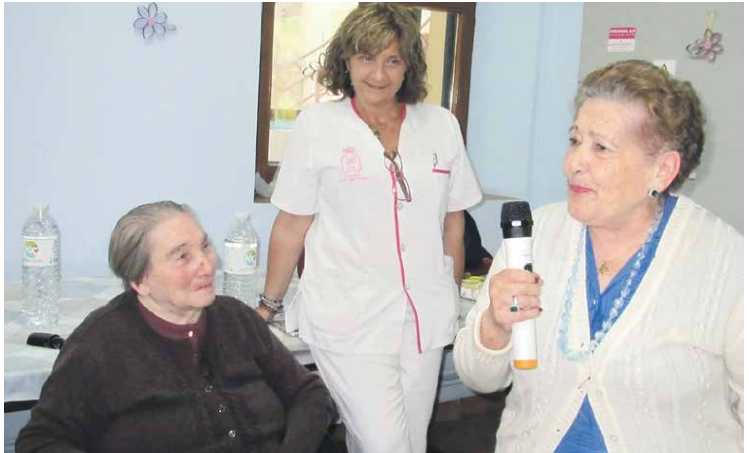
El objetivo de la semana ha sido avivar los cinco sentidos ante el mayor, ante el enfermo, ante el que sufre.

No hay nada más hermoso que salir al encuentro de los demás, ponerse en marcha para compartir ideas, reflexiones, pensamientos, valores, vigores, fuerzas, luces y sombras. Y esto es lo que hemos hecho en esta 'Semana Grande' del mayor en la diócesis de Tarazona, organizada por Cáritas, Vida Ascendente y Pastoral de la Salud: recorrer caminos, ir de pueblo en pueblo, de residencia en residencia para unir energías, ánimos, sueños, dinamismos, flaquezas y debilidades.