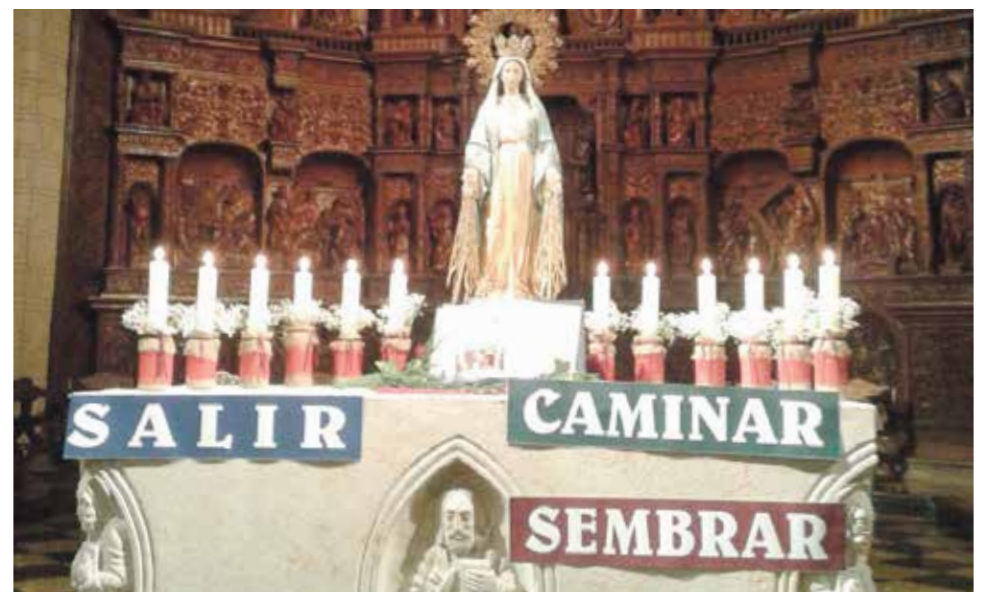
Altar en la Vigilia de Pentecostés.