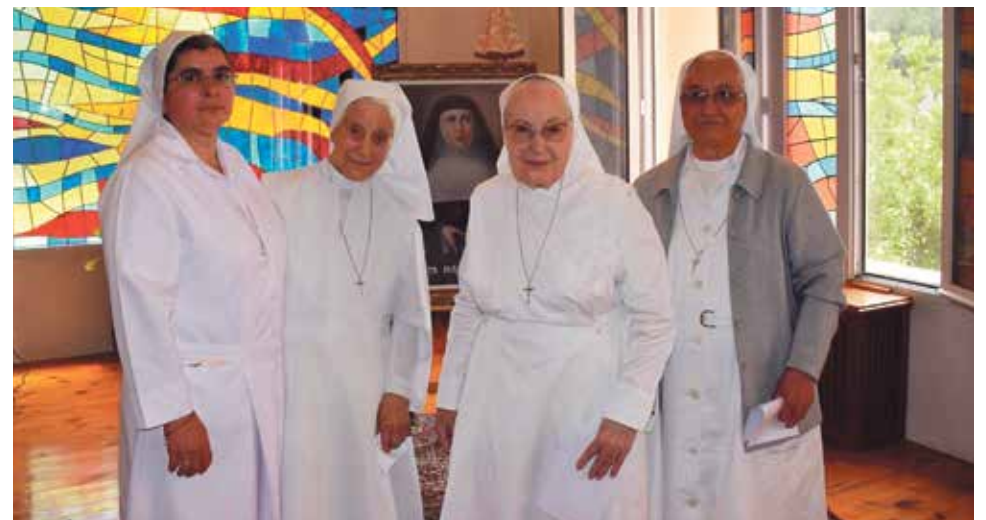
Hermanas de la Caridad de Santa Ana de Burbáguena.

Se recordó la proximidad que siempre ha habido entre las Hermanas y el pueblo de Burbáguena, especialmente en el incendio que hubo que devastó la residencia. La solidaridad de los vecinos siempre será recordada, al igual que el servicio heroico de las Hermanas.