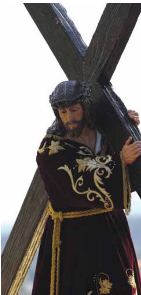
El Nazareno en el Santo Encuentro.

Como todos los años desde la web de la Diócesis de Teruel y Albarracín se ha realizado un importante esfuerzo para fotografiar y grabar en video los principales actos litúrgicos y procesiones de la Semana Santa Turolense.