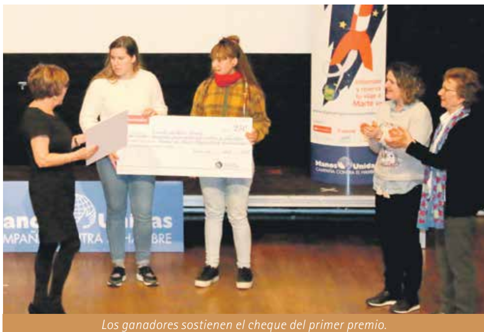
Los ganadores sostienen el cheque del primer premio.

De seguir así, explica Manos Unidas, “corremos el riesgo de acabar con los bosques, los ríos, los grandes océanos y las especies naturales, generando injusticias y desigualdades. Todavía estamos a tiempo de cambiar el futuro. Tan solo es necesario poner en práctica gestos tan sencillos como consumir alimentos producidos de manera más sostenible, comprar con la cabeza y cocinar lo justo”.