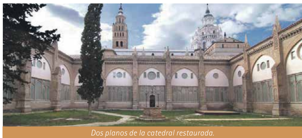
Dos planos de la catedral restaurada.