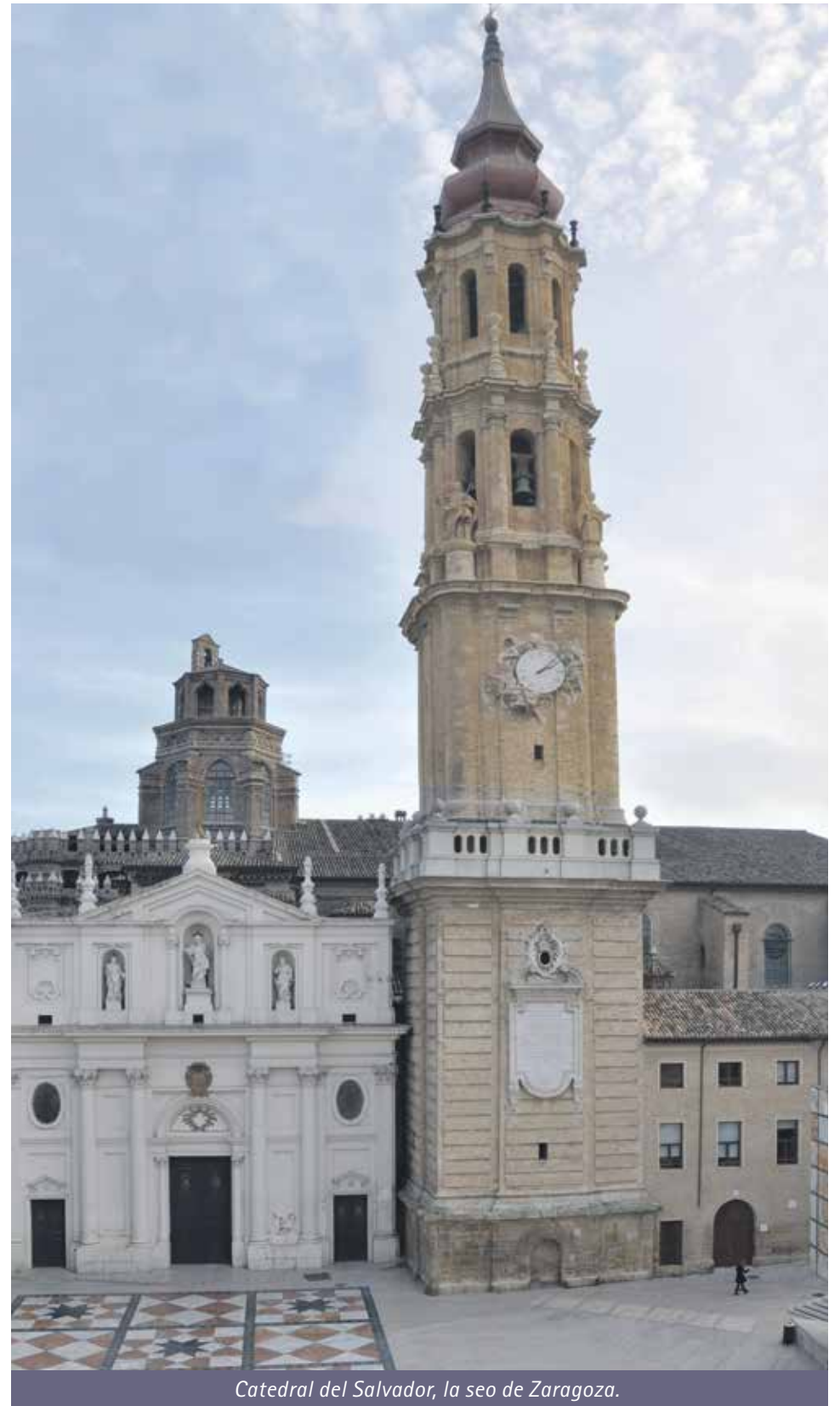
Catedral del Salvador, la seo de Zaragoza.

¿En qué consisten estas garantías? La más básica es velar por que el patrimonio se conserve con criterios técnicos y con intervenciones suficientes. Al propietario le corresponde mantenerlo, pero también ha de contar con la colaboración del