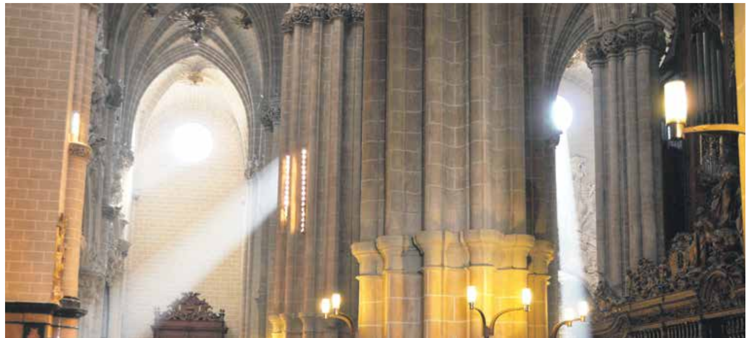
La Seo aúna diferentes estilos, empezando por el Románico y siguiendo por el Gótico, Mudéjar, Renacentista, Barroco y Neoclásico.