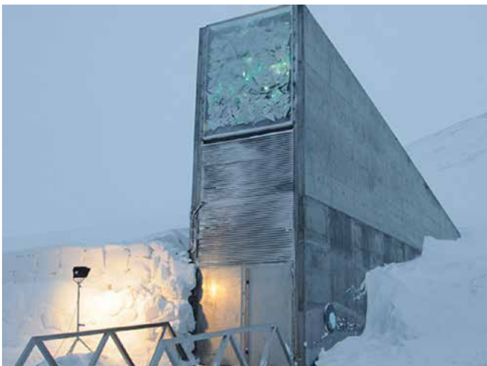
La bóveda del fin del mundo.