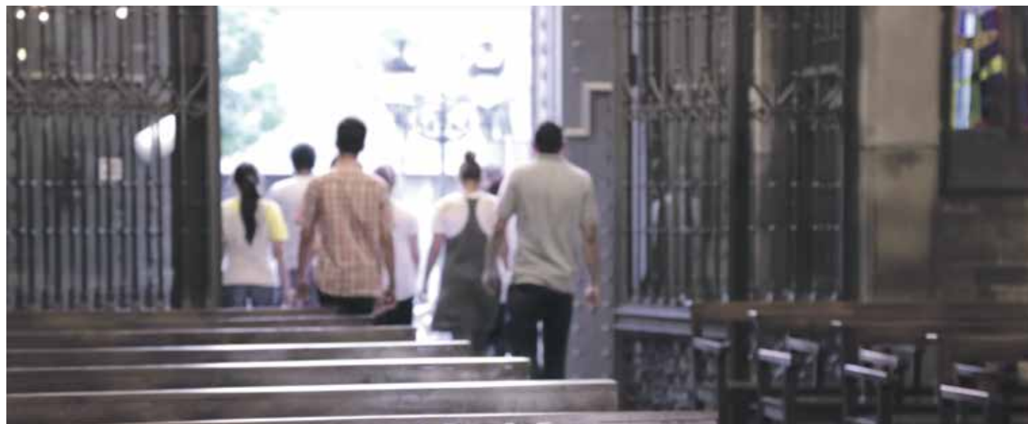
El nuevo curso es una oportunidad para abrir las puertas, también de nuestros corazones, y volver a empezar.

'El vídeo del Papa' lanzado a las redes para el mes de septiembre nos sorprende con una reflexión sobre las parroquias. En poco más de un minuto podemos observar un cauce contaminado, un anciano bebiendo agua insalubre... y un grupo de personas limpiando el río. La parábola se vuelve más evidente cuando vemos a estos mismos voluntarios saliendo de su parroquia. El cuidado de la creación es también el cuidado de la cultura, de los valores, de las relaciones y, ¡cómo no!, de las personas.