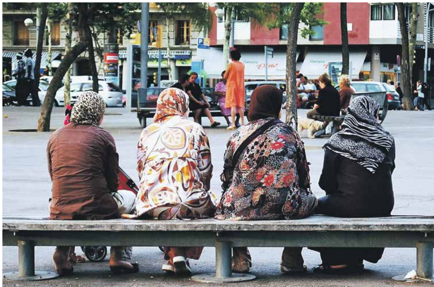
La aceptación de la comunidad islámica, en global, es menos favorable que la del musulmán en particular.

Más homogénea es la respuesta a la pregunta de si "los musulmanes quieren adoptar nuestras costumbres".