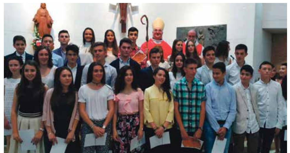
Confirmaciones en Santa Emerenciana de Teruel.