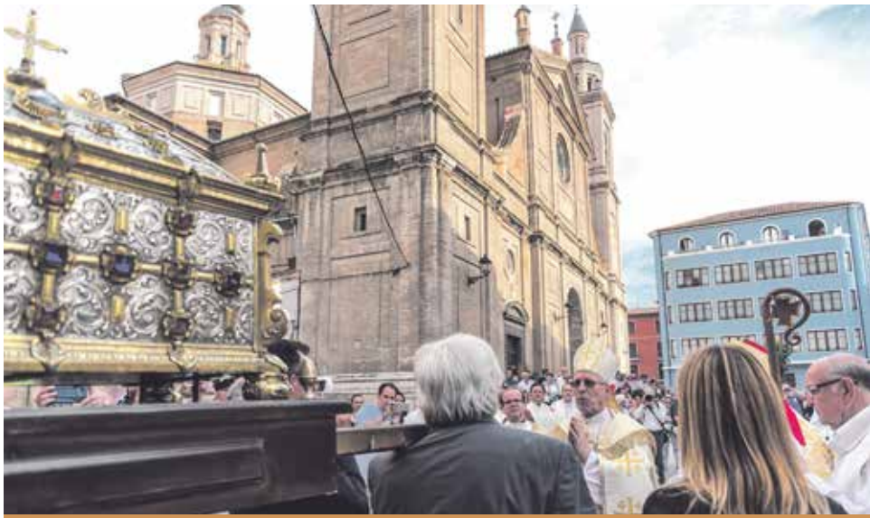
Momento de la recepción de la urna con los restos del santo.

El día 1 de junio fue un día especial para Calatayud y para la diócesis de Tarazona: San Íñigo, uno de sus hijos elevado a los altares, regresa a su pueblo natal para ser honrado por sus paisanos. Por Andrés Roque.