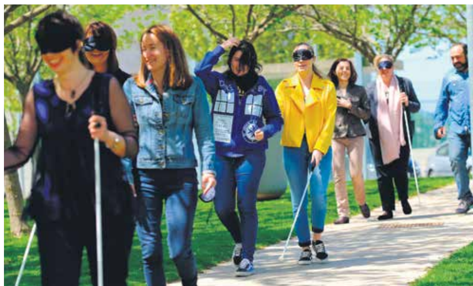
La USJ ha participado en diferentes talleres de sensibilización sobre discapacidad.

La Universidad San Jorge (USJ) organiza el primer campus inclusivo "Plantéate una vida sin límites" del 8 al 14 de julio, dentro del programa 'Campus Inclusivo, campus sin límites'. Con esta iniciativa, impulsada por el área de Pastoral y el vicerrectorado de Ordenación Académica y Estudiantes, la USJ brinda la oportunidad de tener una experiencia de vida universitaria a alumnos de segundo ciclo de ESO, Bachillerato y ciclos formativos que tengan algún tipo de discapacidad.