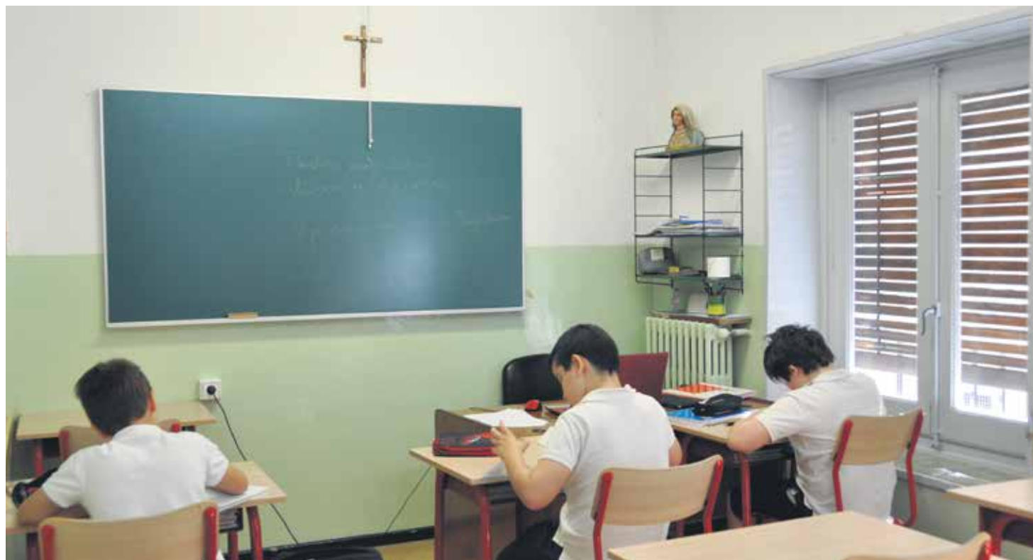
La escuela católica está al servicio de la formación de comunidades humanas responsables.

Se trata de unos datos que hemos de poner en valor. Sobre todo en los momentos actuales, en los que por algunos sectores se cuestiona la labor de la Iglesia en el mundo de la educación y se pretende deslegitimar la presencia de la escuela católica entre los distintos agentes que intervienen en la política educativa.