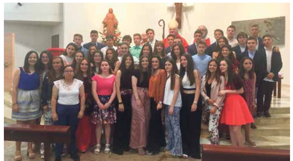
Los jóvenes confirmados de Santa Emerenciana posan junto al Sr. Obispo.