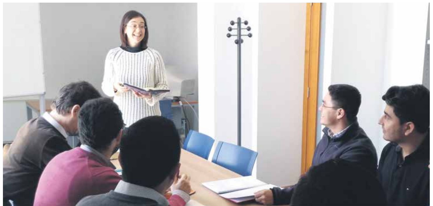
El CRETA y el ISCR Nuestra Señora del Pilar forman a seminaristas, seglares, religiosos y agentes de pastoral de todo Aragón.

La DECA garantiza la adecuada transmisión del mensaje cristiano