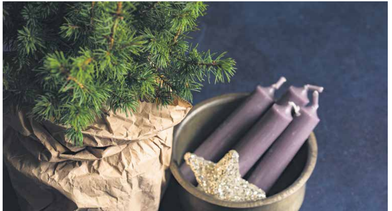
En Adviento debemos esforzarnos por descubrir las promesas mesiánicas: la paz, la justicia y la relación fraternal.

5.- El Adviento es un tiempo atractivo, cargado de contenido, evocador, válido... Vivir el Adviento cristiano es revivir poco a poco aquella gran esperanza de los grandes pobres de Israel desde Abraham a Isabel, desde Moisés a