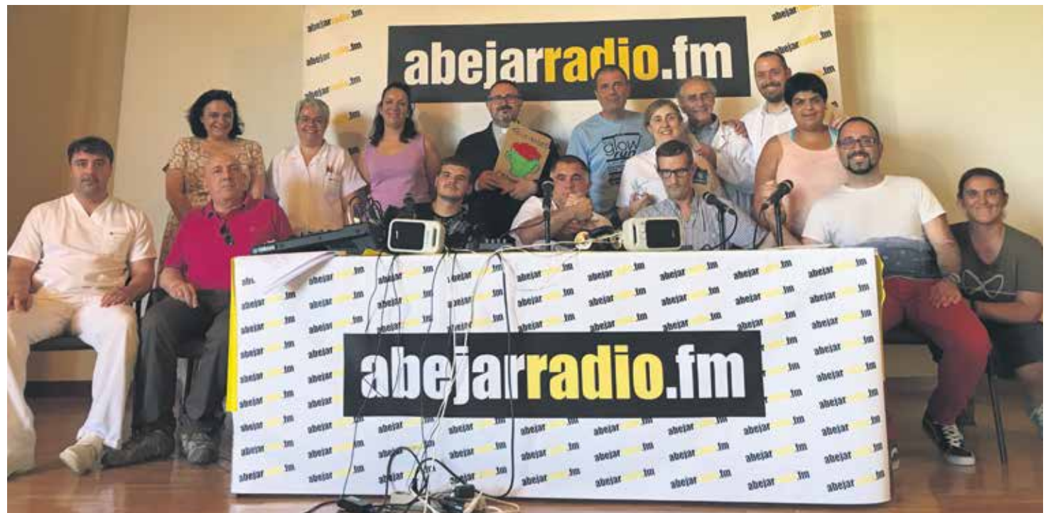
Abejar Radio es una ventana abierta al mundo, que rompe barreras y crea relaciones.

Las Hermanas Hospitalarias del Sagrado Corazón de Jesús llegaron a Zaragoza en 1971. Esta Congregación fue fundada en Ciempozuelos (Madrid) en 1881, por san Benito Menni, un sacerdote miembro de la Orden de San Juan de Dios. Su objetivo fundacional fue dar respuesta a la situación de abandono sanitario y exclusión social de las enfermas mentales de la época, aunando caridad y ciencia.