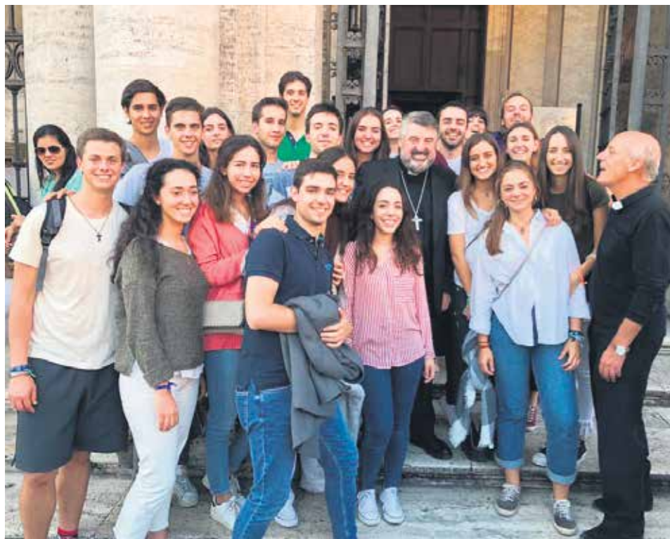
Monseñor Escrivano, rodeado de jóvenes, durante el Sínodo de octubre.

La Pastoral Juvenil es una prioridad a la que hay que dedicar medios, recursos y personas. Un buen acompañamiento exige trabajar por proyectos, no por departamentos,