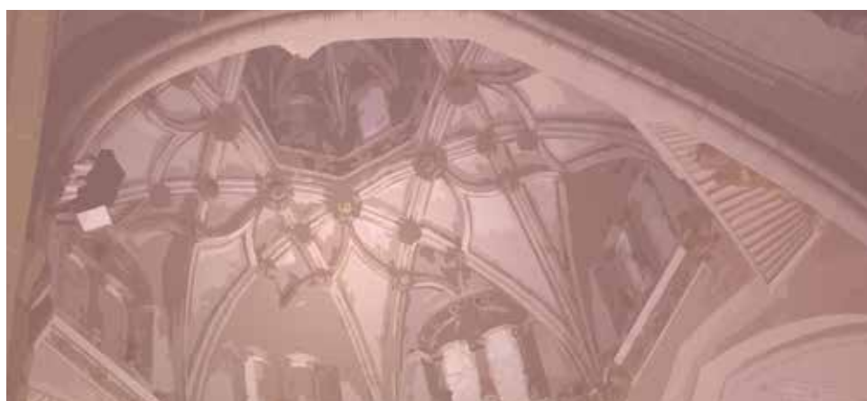
Detalle del cartel de la Jornada Diocesana de Liturgia.

El sábado, 15 de diciembre, la Delegación de Liturgia organiza su tradicional Jornada Diocesana con el lema "La Liturgia, fuente de oración y santificación".