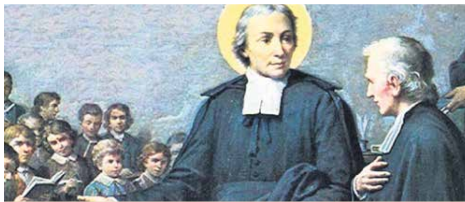
San Juan Bautista de la Salle es patrono de los educadores cristianos.

Por este motivo, el 21 de noviembre, el colegio La Salle Franciscanas Gran Vía de Zaragoza se sumó a una acción conjunta llevada a cabo por todas las obras educativas de la red y desplegó una lona conmemorativa con la que, aprovechando el tricentenario, recordaron no solo al fundador, sino el carisma y la identidad lasalianos.