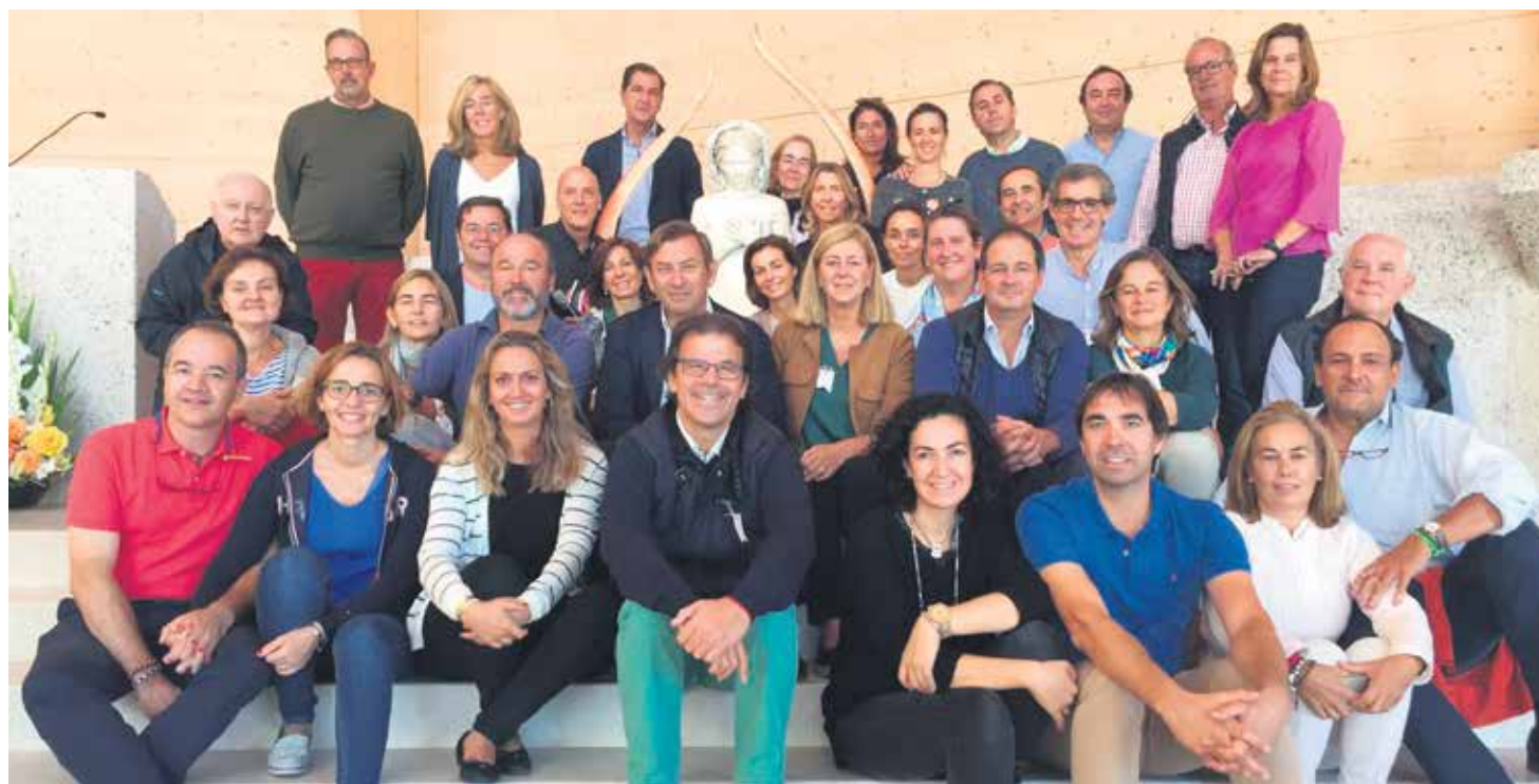
Universitarios, profesionales, padres de familia... Todos tienen cabida en la familia de Hakuna.

Durante el encuentro, el papa Francisco animó a los jóvenes a que "no balconen sus vidas", que