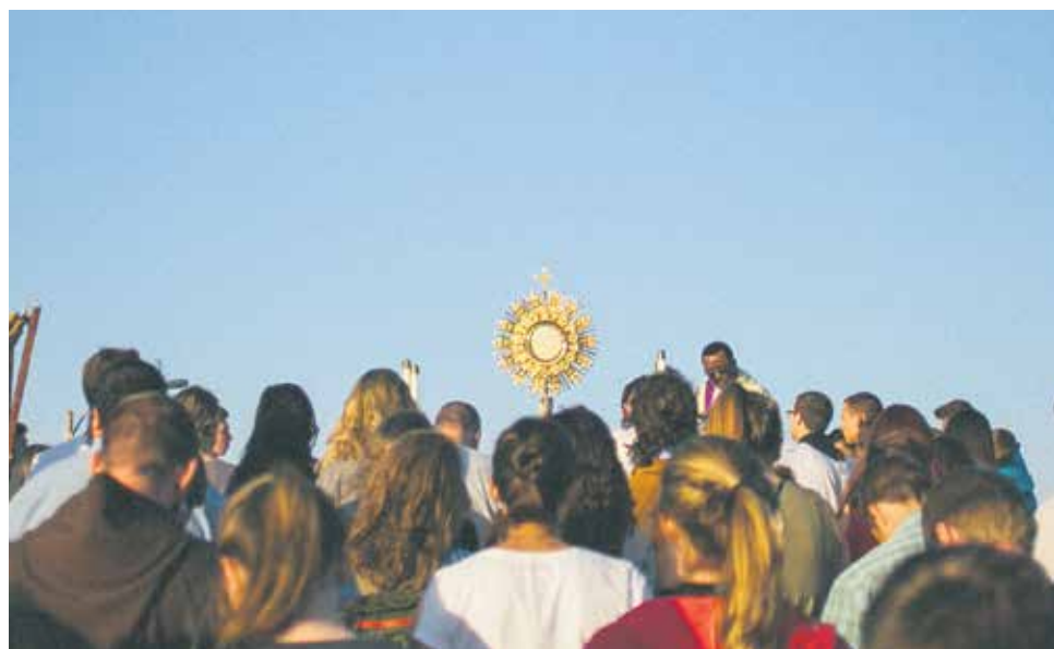
Por la oración y penitencia dejaremos que arraigue la justicia, prevención y reparación.