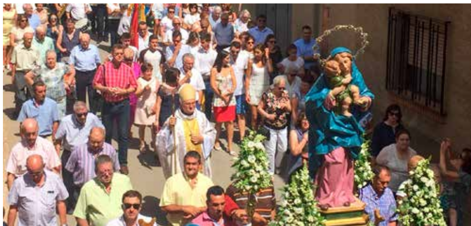
Celebración de la Virgen de la Salud de Celadas.