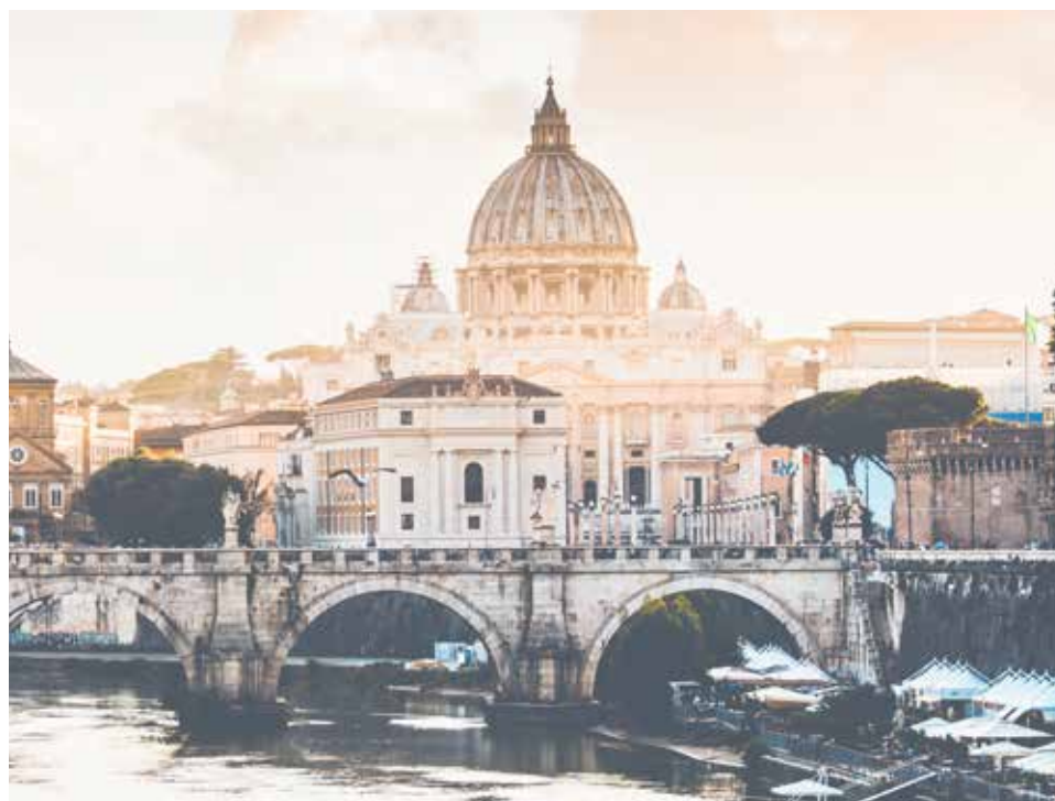
El Papa pide que se garantice la protección de los menores en situación de vulnerabilidad.

En los últimos días se dio a conocer un informe donde se detalla lo vivido por al menos mil sobrevivientes, víctimas del abuso sexual, de poder y de conciencia en manos de sacerdotes durante aproximadamente setenta años. Si bien se pueda decir que la mayoría de los casos corresponden al pasado, sin embargo, con el correr del tiempo hemos conocido el dolor de muchas de las víctimas y constatamos que las heridas nunca desaparecen y nos obligan a condenar con fuerza estas atrocidades, así como a unir esfuerzos para erradicar esta cultura de muerte; las heridas “nunca prescriben”. El dolor de estas víctimas es un gemido que clama al cielo, que llega al alma y que durante mucho tiempo fue ignorado, callado o silenciado. Pero su grito fue más fuerte que todas las medidas que lo intentaron silenciar o, incluso, que pretendieron resolverlo con decisiones que aumentaron la gravedad cayendo en la complicidad. Clamor que el Señor escuchó demostrándonos, una vez más, de qué parte quiere estar. El cántico de María no se equivoca y sigue susurrándose a lo largo de la