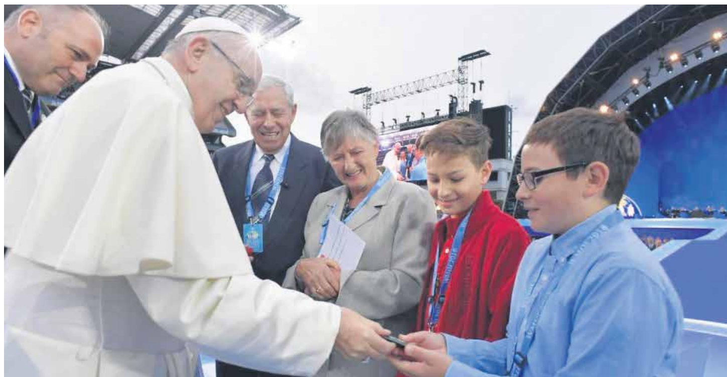
El papa Francisco congregó en Dublín a miles de familias de todo el mundo.

“ Que los niños hablen con sus abuelos, raíces profundas del amor