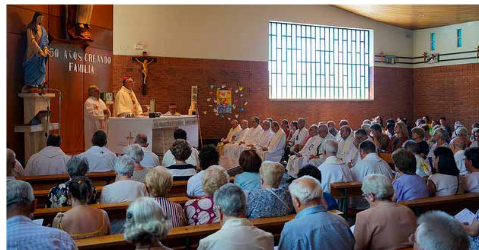
El primer sábado de agosto, se celebró en Teruel el Día del Misionero Diocesano.