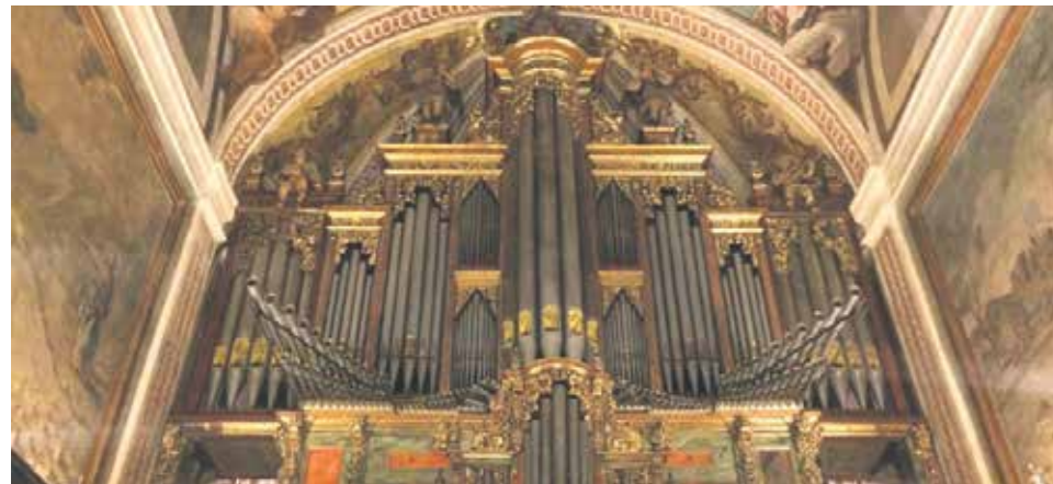
El órgano de Jaca ha recuperado su mejor versión.

El pasado 25 de agosto se inauguró en la catedral de Jaca la restauración de su órgano gracias al mecenas César Alierta Izuel, quien, según ha afirmado Jesús Lizalde, canónigo y organista de la catedral de Jaca, "ha financiado en su totalidad la restauración completa, haciendo posible el proyecto, cuyo coste total está en torno a los 300.000 euros".