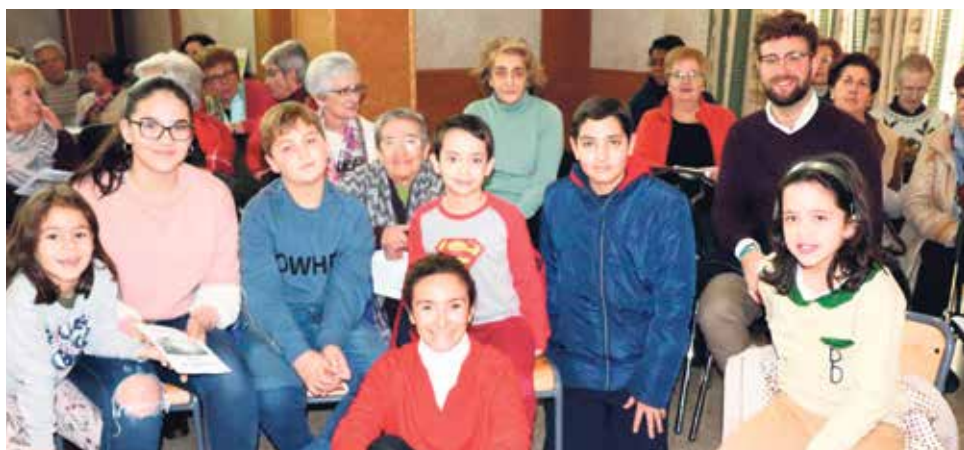
Niños y mayores de todas las edades participaron en tan hermosa celebración.

El pasado 14 de enero, en una tarde tranquila y soleada, laicos de todas las edades, religiosas y sacerdotes nos reunimos en los salones de la parroquia de Santa Emerenciana para celebrar la PAZ de Jesús.