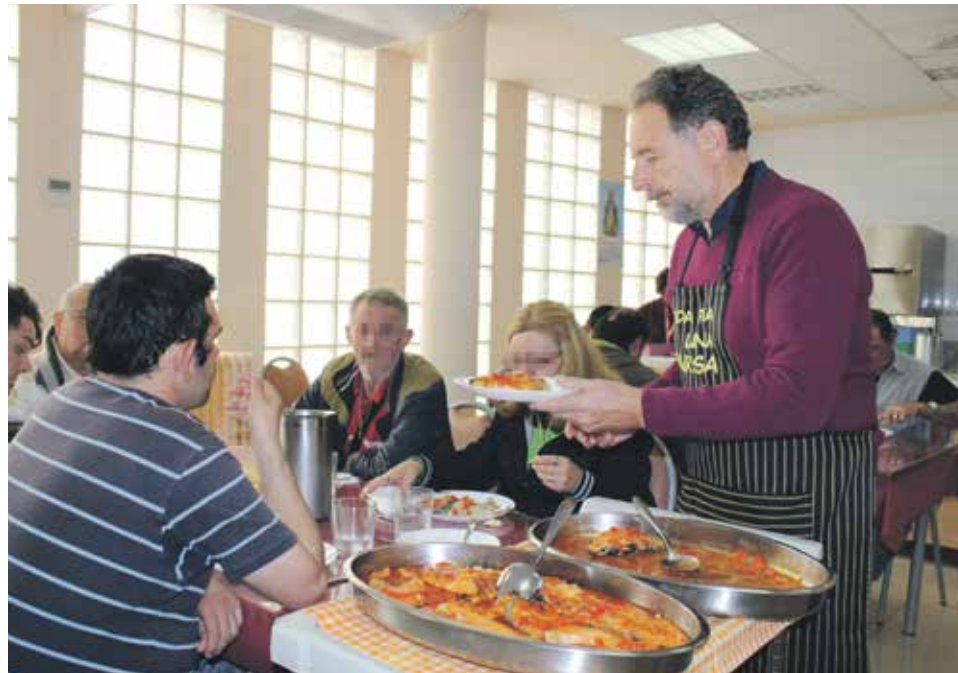
Comedor social de las Hijas de la Caridad de san Vicente de Paúl, en Zaragoza.

La iniciativa, pionera entre las diócesis españolas, se enmarca dentro de su Plan de Transparencia y del proyecto 'San Valero, de par en par', queriendo mostrar no solo números, sino los rostros de las personas y la identidad de las comunidades que en el día a día realizan la misión de la Iglesia zaragozana, que celebra el VII centenario de su elevación a sede metropolitana.