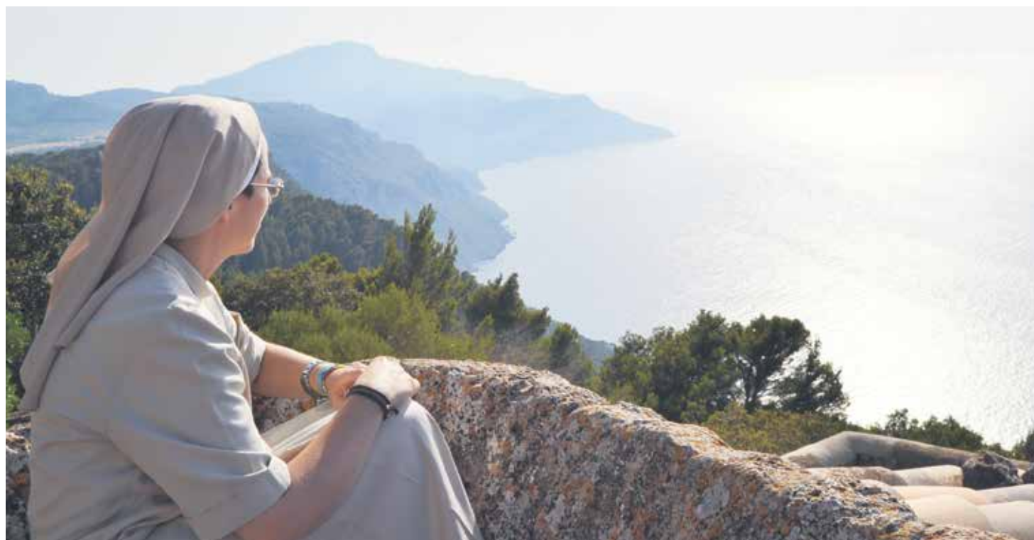
“Estar en el mundo sin ser del mundo, para ser sal y levadura que, sin ser vista, va obrando para la edificación del Reino”.

El 2 de febrero, fiesta litúrgica de la Presentación del Señor, se celebra la Jornada Mundial de la Vida Consagrada. “La vida Consagrada, encuentro con el Amor de Dios” es el lema de esta Jornada que se presenta como una “nueva ocasión de entrar en lo íntimo de uno mismo, para ver qué es lo esencial, lo más importante para nosotros, y qué nos está distrayendo del amor y por tanto nos impide ser felices”.