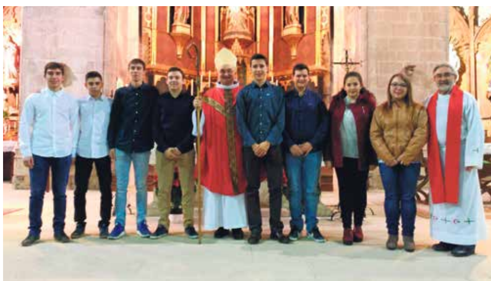
Hacia 17 años que no había confirmaciones en Mora de Rubielos.