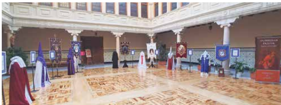
Exposición de indumentaria y estandartes de la Semana Santa de Teruel.

La Junta de Cofradías y Hermandades de la Semana Santa de Teruel nos ha presentado los actos culturales que van a desarrollar previos a la Semana Santa.