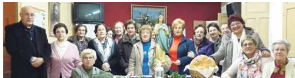
Segundo encuentro de oración en la localidad de Villalba Baja.

El domingo 18 de febrero tuvo lugar el primer encuentro de oración que Acción Católica General ha preparado para este tiempo de Cuaresma. Lo celebramos en Blancas, con una numerosa asistencia de parroquianos de casi todos los pueblos del arciprestazgo de Calamocho y sus sacerdotes.