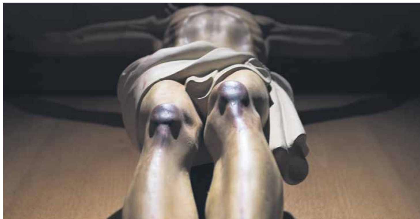
La Cuaresma supone el tiempo necesario, el tiempo completo, el tiempo oportuno que la Iglesia nos ofrece para nuestra salvación.

En el Nuevo Testamento, Jesús fue presentado en el templo a los 40 días de su nacimiento (Lc 2,22), como mandaba la Ley (Lev 12). Durante 40 días permaneció en el desierto antes de iniciar su vida pública (Mt