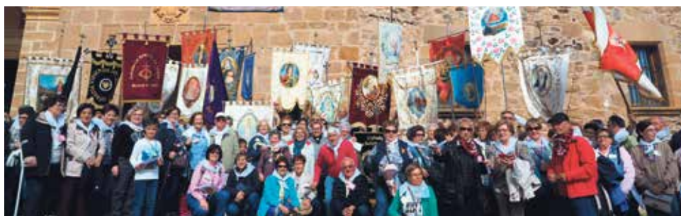
Gran éxito del encuentro de Cofradías celebrado en el Olivar.

En nuestra web diocesana pueden ver todas las fotos del encuentro realizadas por el Padre Mercedario Fernando Ruíz Valero.