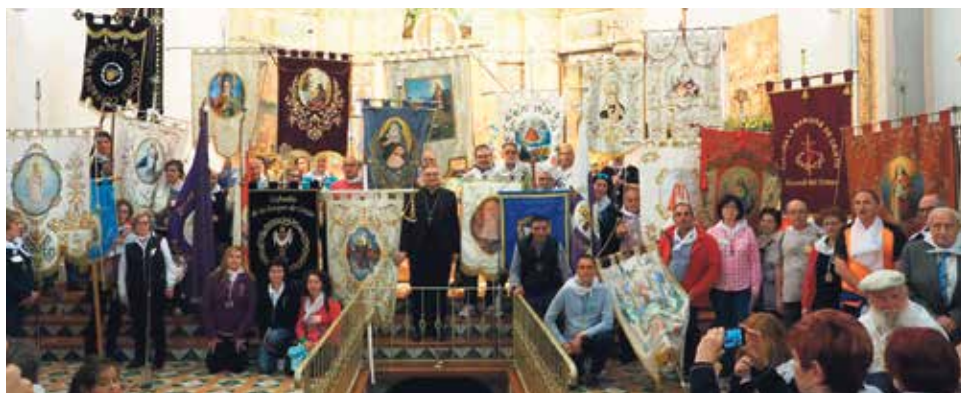
Don Antonio junto a los estandartes de las Cofradías participantes del encuentro.

El sábado, 28 de abril, nuestro Obispo convocó a todas las cofradías de la diócesis: devocionales, sacramentales y penitenciales a encontrarse en Esteruel, en el Primer Encuentro Diocesano de Cofradías. Fue un día claro que permitió hacer un Vía Lucis de cuatro kilómetros que es la distancia entre Esteruel y el monasterio del Olivar. Participaron casi medio millar de cofrades con sus estandartes, banderas, medallas y tambores. En la última estación "pentecostés" les recibía nuestro obispo para hablarles del nacimiento de la Iglesia y el empuje del Espíritu Santo. A pocos metros terminaba el Vía Lucis a los pies de Nuestra Señora del Olivar: en oración con María.