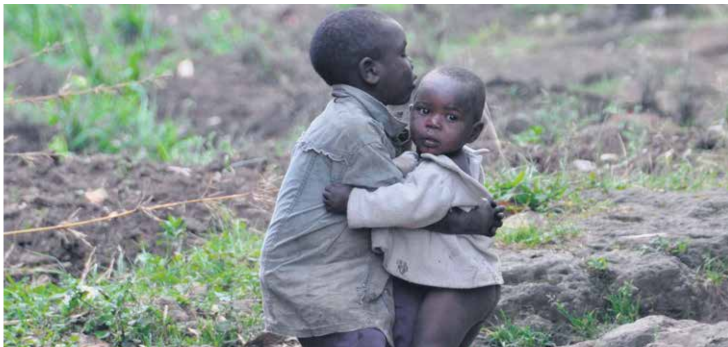
Dios invita a amar infinitamente a cada persona, con auténtico espíritu cristiano.

Frente a grandes teorías o abundantes explicaciones, el Santo Padre identifica las bienaventuranzas como el "carnet de identidad del cristiano". En el tercer capítulo de 'Gaudete et exsultate', titulado 'A la luz del maestro', apunta la necesidad de apoyarse en el Espíritu Santo para vivir el mensaje de Jesús, porque aunque es atractivo, "en realidad el mundo nos lleva hacia otro estilo de vida".