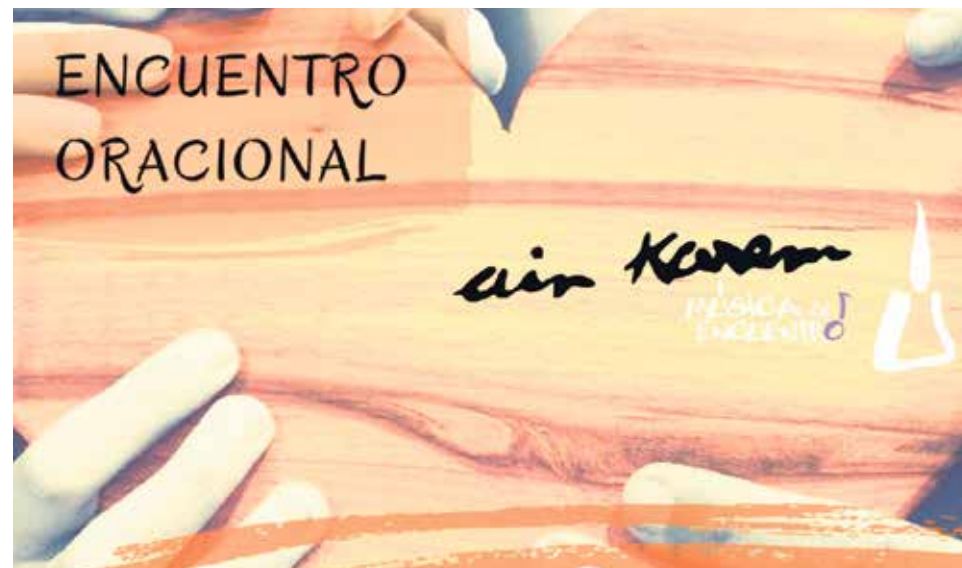
Cartel del Encuentro Oracional de Ain Karem del próximo 12 de mayo.

Para el próximo sábado, 12 de mayo, la Pastoral Juvenil de Teruel ha conseguido convocar a los componentes del proyecto Ain Karem, referente a nivel nacional de evangelización a través de la música.