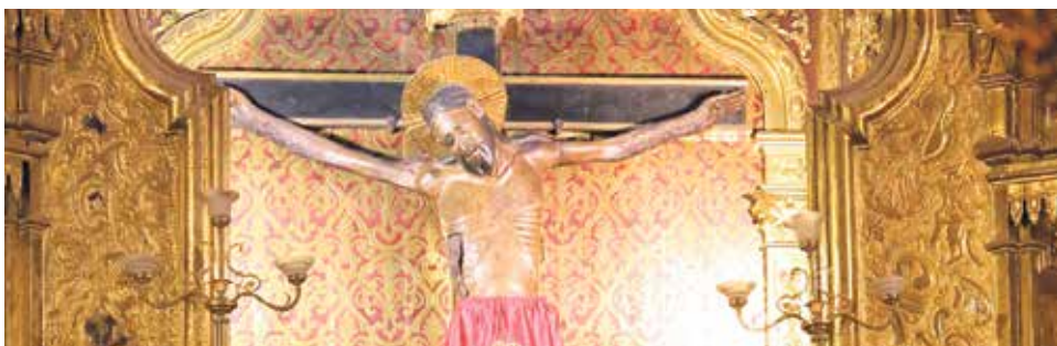
Talla del Santo Cristo del Salvador de Teruel, o de las "tres manos".