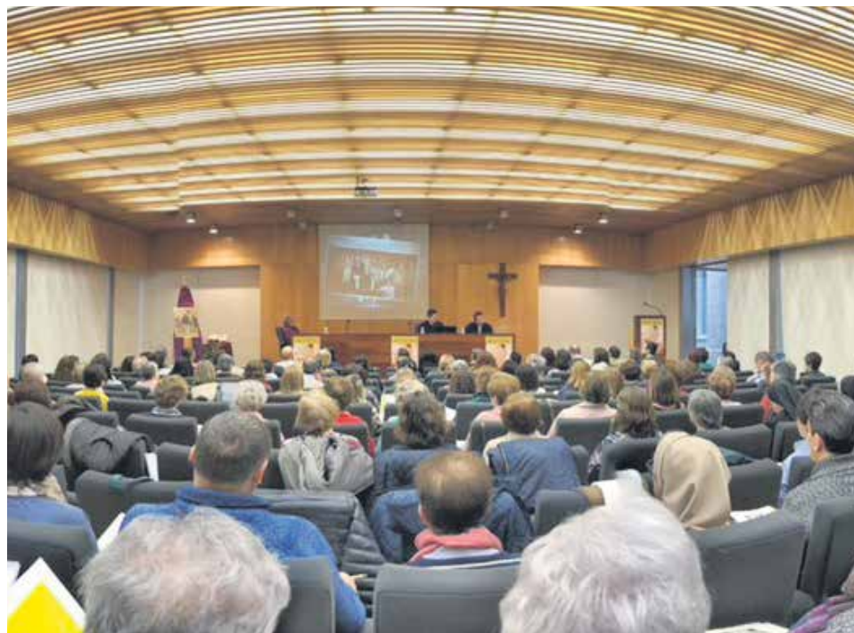
Evangelizar hoy exige adaptar los lenguajes y mantener una alegre experiencia de fe.

Por otro lado, el encuentro abordó la catequesis desde el arte, gracias