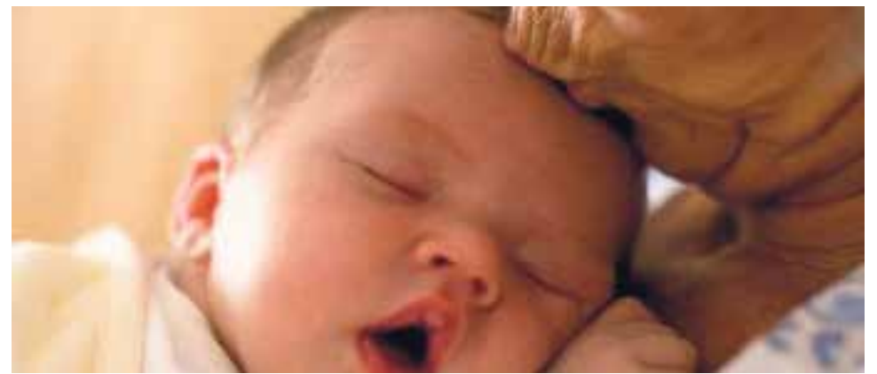
Cartel de la Jornada por la Vida del próximo 17 de marzo.

El día 17 de marzo celebraremos en nuestra diócesis la Jornada por la Vida con el lema: “Educar para acoger el don de la vida”.