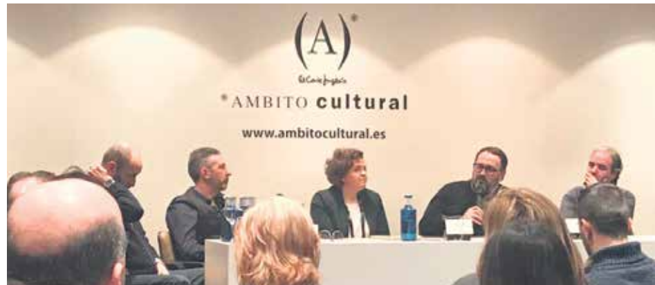
Las cofradías se esfuerzan por comunicar los 365 días del año.

En particular, Pardos contó la experiencia de las retransmisiones en directo de los momentos más sugestivos de las procesiones, llegando a "15, 20, 30.000 personas a través