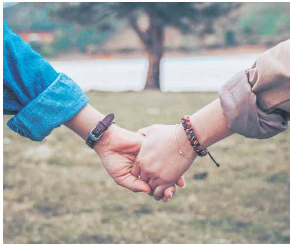
La Iglesia llama a responder con generosidad a los desafíos migratorios del siglo XXI.

Proteger: Este verbo “se conjuga en toda una serie de acciones en defensa de los derechos y de la dignidad de los emigrantes y refugiados, independientemente de su estatus migratorio. Esta protección comienza en su patria y consiste en dar informaciones veraces y ciertas antes de dejar el país, así como en la defensa ante las prácticas de reclutamiento ilegal. En la medida de lo posible, debería continuar en el país de inmigración, asegurando a los