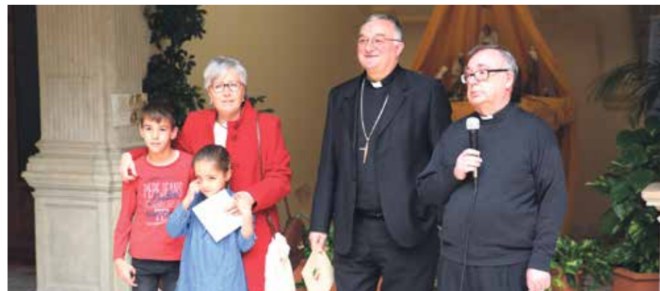
El martes, 26 de diciembre, se celebró el homenaje en el patio del obispado.