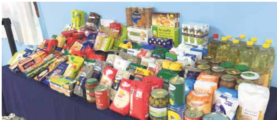
120 kilos de alimentos no perecederos fueron recogidos.

En la pequeña localidad turolense de Celadas, un grupo de jóvenes preocupados por el buen funcionamiento y la vida activa de su parroquia han realizado y programado una serie de actos para conmemorar el 60 aniversario de bendición de su querida Virgen de la Salud.