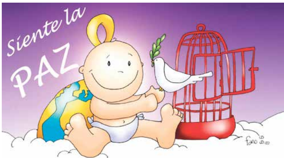
Cartel de la celebración de la fiesta de la Paz de ACG.

En estas fechas, como cada año, Acción Católica General os quiere invitar a una fiesta muy especial, que tendrá lugar este domingo, 14 de enero, a las 17 horas en el salón parroquial de Santa Emerenciana. Esta vez vamos a celebrar la PAZ que Jesús nos trae. Una PAZ que nosotros, cada día, tenemos que ir construyendo con abrazos, escuchando las necesidades de los