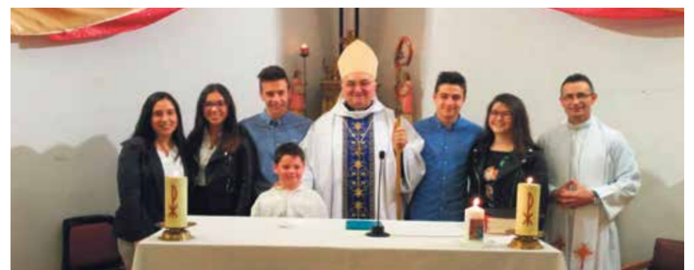
Nuestro Obispo posa con los confirmados de Montalbán.