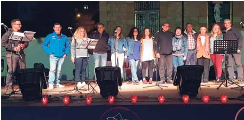
En la Cena Solidaria actuaron Brotes de Olivo y el Coro de la Pastoral Juvenil.

Con motivo de la festividad del Corpus, Cáritas Diocesana de Teruel ha estado celebrando varias actividades en su XII Semana con Corazón.