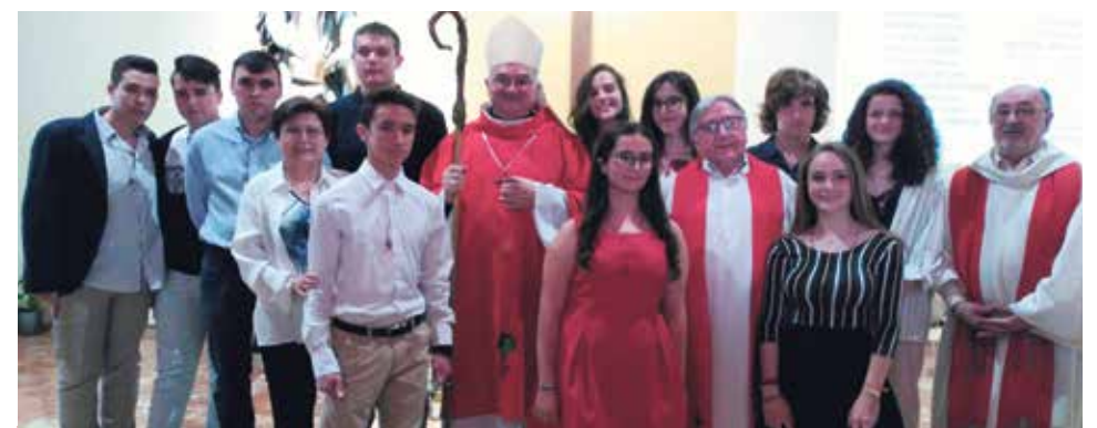
Jóvenes confirmados de la Parroquia turolense de San Julián.