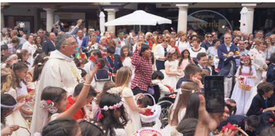
Los niños de primera comunión arrojan pétalos de rosas a la Custodia.