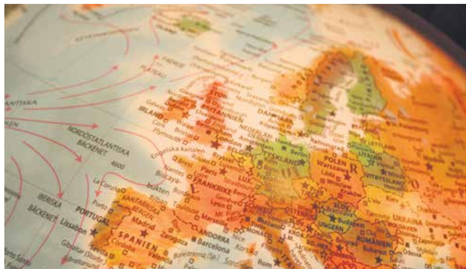
Enseñar Religión en las escuelas públicas es legítimo, según el Tribunal Constitucional.

Uno de ellos consiste en una asignatura obligatoria que ofrece una perspectiva histórico-cultural al fenómeno religioso. Es propio de los países nórdicos y Reino Unido. Otro modo de afrontarlo es el confesional. Esto significa que se estudia una religión como una doctrina y un fenómeno vivo, intentando asegurar su correcta impartición, sin riesgo a errores, y por eso sus contenidos corren a cargo de las confesiones, lo que también explica que su seguimiento sea voluntario. Es el