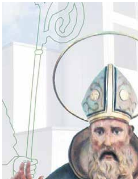
Busto de san Ignacio Clemente Delgado.