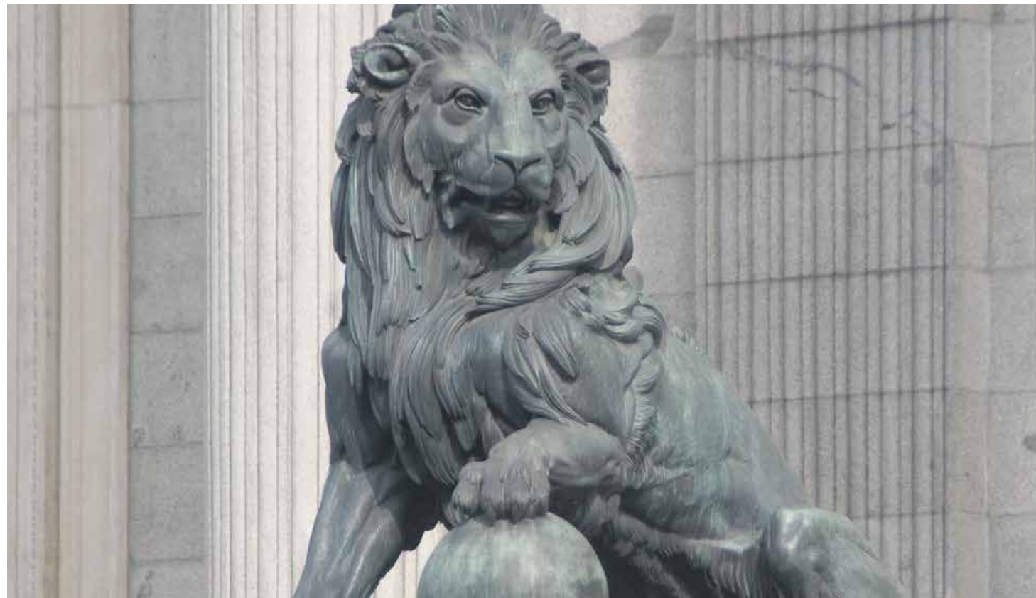
En España, desde 2007 no existe ninguna asignación en los Presupuestos Generales del Estado para la Iglesia católica.

En muchos países europeos existen grandes cantidades de asignación directa para la Iglesia. En España, desde 2007 no existe ninguna asignación en los Presupuestos Generales del Estado para la Iglesia católica y tampoco con ningún otro mecanismo. En Francia, adalid del laicismo, desde la Revolución Francesa los edificios religiosos pertenecen al Estado, pero es el propio Estado el único responsable