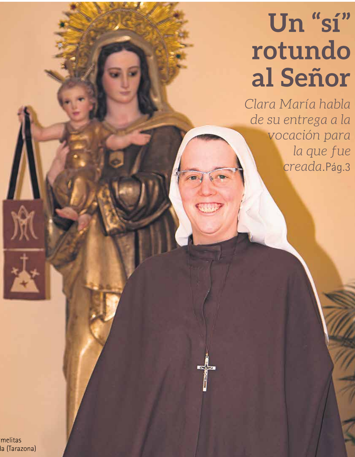
Monasterio de las Carmelitas Descalzas de Maluenda (Tarazona)