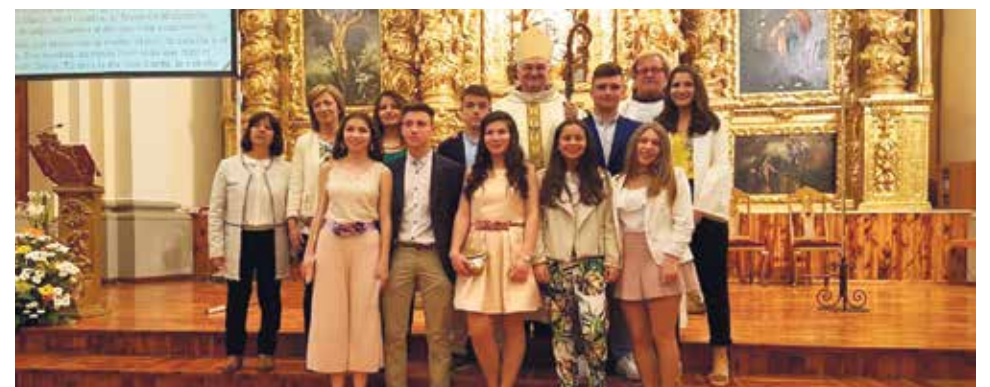
Confirmaciones en la Parroquia de Cella.