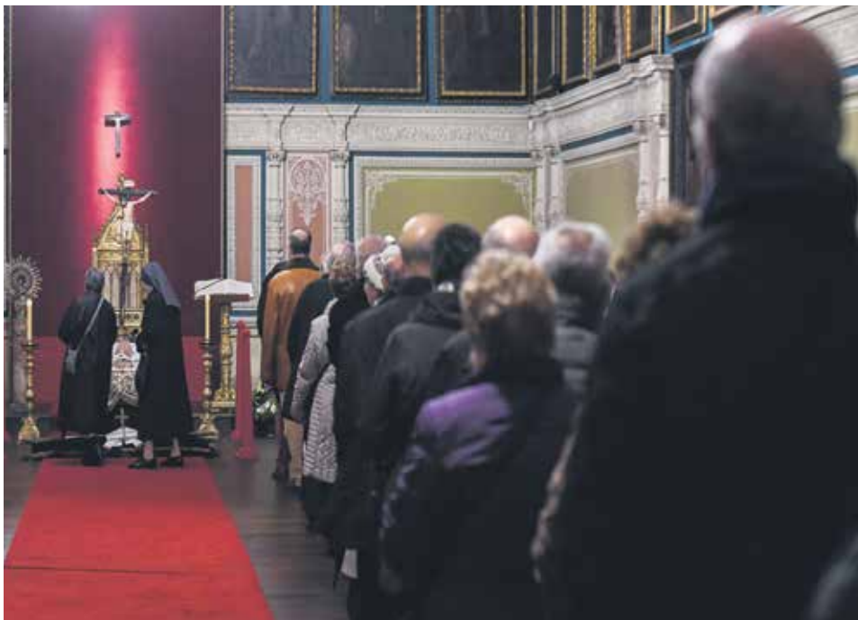
El 'Salón del Trono' del palacio arzobispal acogió la capilla ardiente de monseñor Yanes.