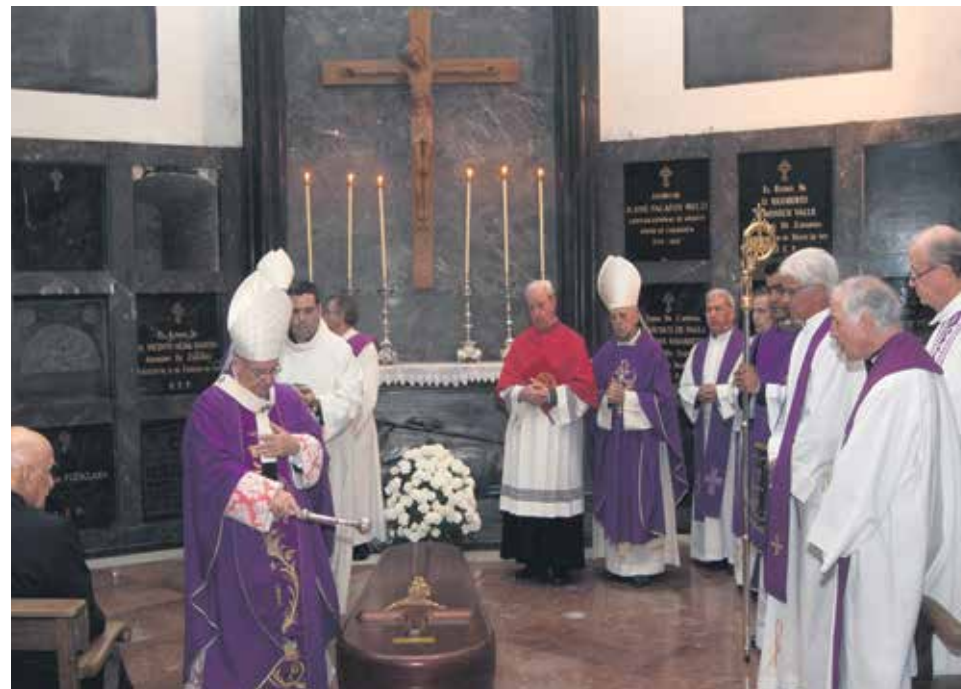
La inhumación tuvo lugar en la cripta mortuoria de la catedral-basílica del Pilar.