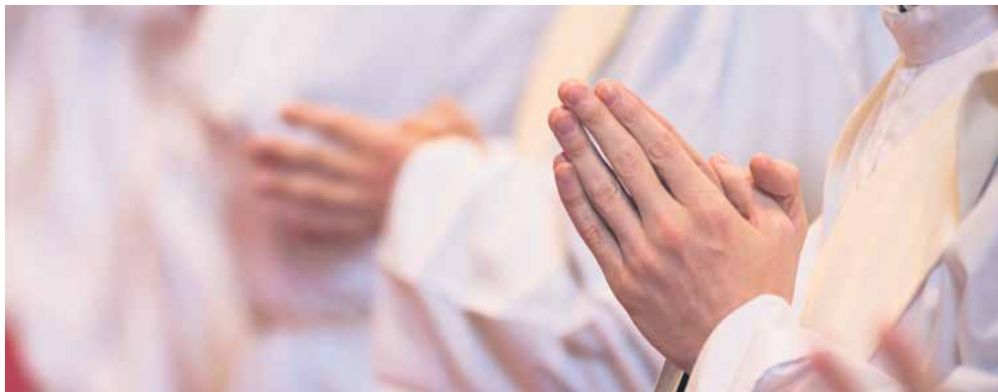
Los consejos a los sacerdotes de finales del siglo XIX siguen iluminando en la actualidad.