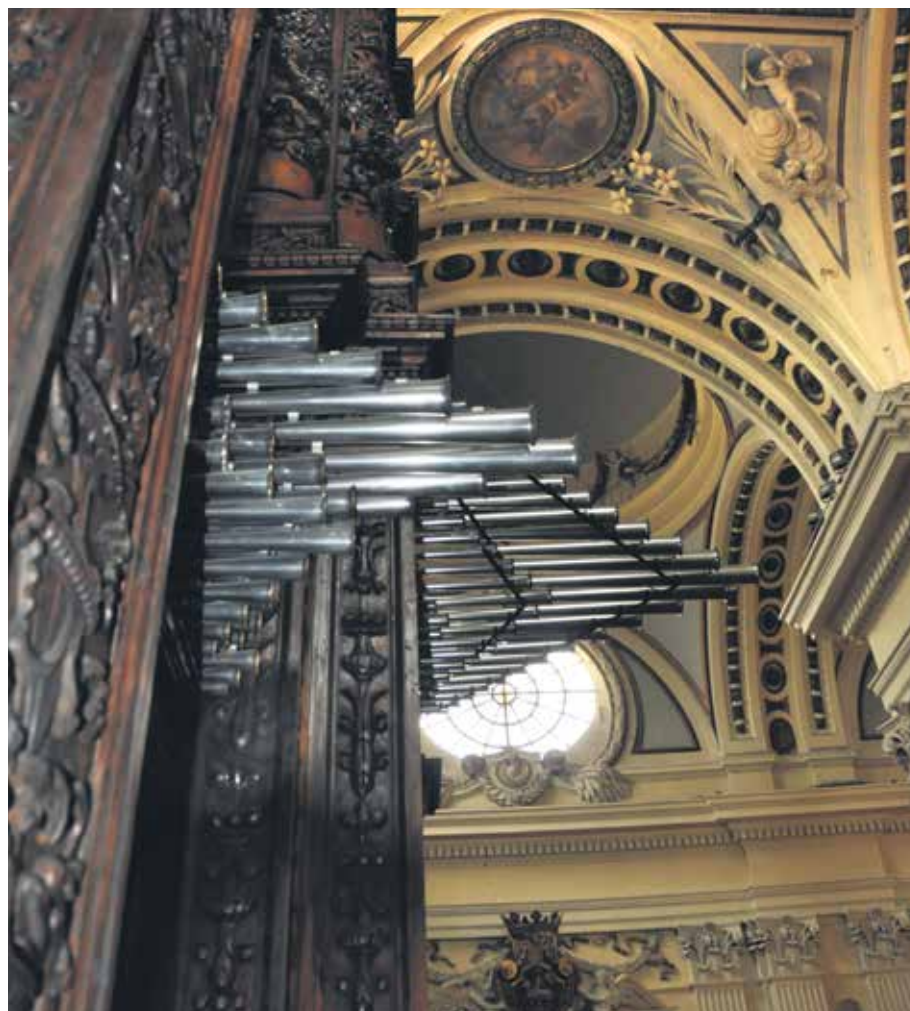
Grandiosa perspectiva del órgano de la basilica del Pilar de Zaragoza.

Música sacra de todas las épocas y de todos los estilos, con músicos aragoneses e internacionales, gratuita para todos los que deseen participar en las audiciones, sea cual sea su condición o creencia, un regalo de la Iglesia a la sociedad zaragozana. Con cualquiera de estas frases podría titularse esta información, incluso diciendo que la Iglesia sigue creando y recreando patrimonio cultural del más alto nivel en aquellas sociedades en las que está implantada: la buena relación entre Iglesia, cultura y bellas artes es una realidad más que evidente.