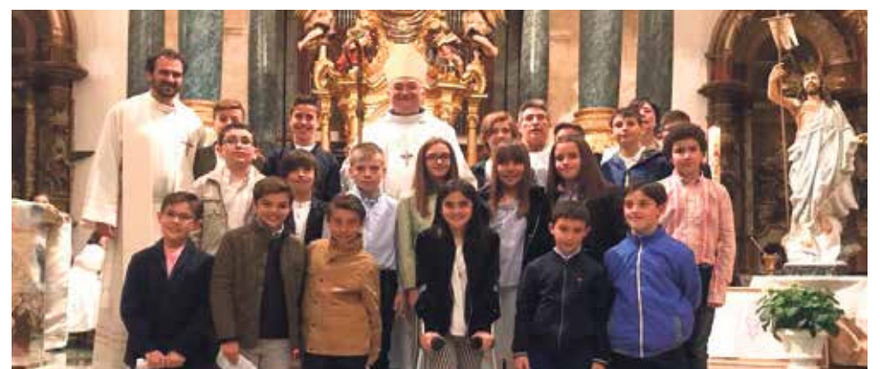
Confirmaciones en la Parroquia de Calamocho.