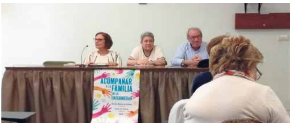
Momento del encuentro "Acompañar a la familia en la enfermedad".