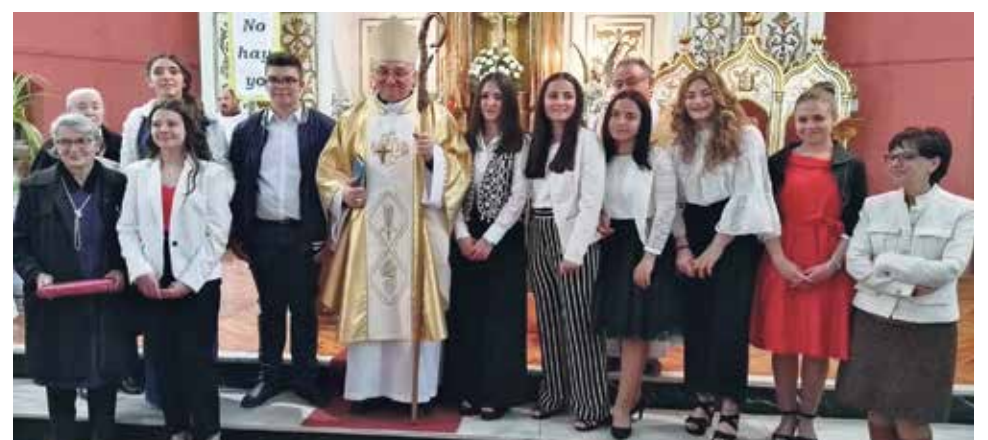
Los jóvenes confirmados de Monreal del Campo junto al Sr. Obispo.