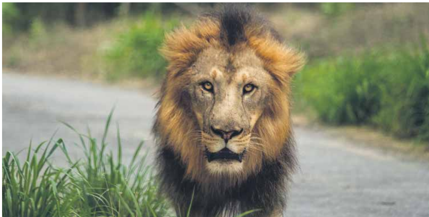
Nuestro camino hacia la santidad es también una lucha constante.

En el quinto y último capítulo de 'Gaudete et exsultate', el papa Francisco advierte que la vida cristiana es un combate permanente. Una lucha "muy bella" porque permite celebrar la victoria del Señor en nuestra vida, pero que requiere "fuerza y valentía para resistir las tentaciones del diablo y anunciar el Evangelio". Veamos las últimas reflexiones del Santo Padre sobre cómo vivir una santidad auténtica en nuestro mundo.