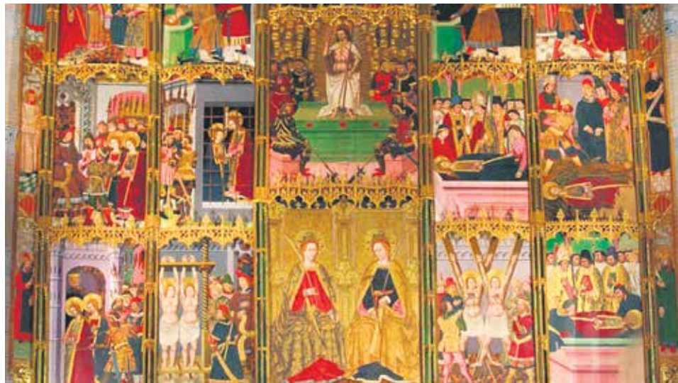
Retablo gótico de la iglesia de Santas Justa y Rufina (Maluenda) dedicado a su martirio.