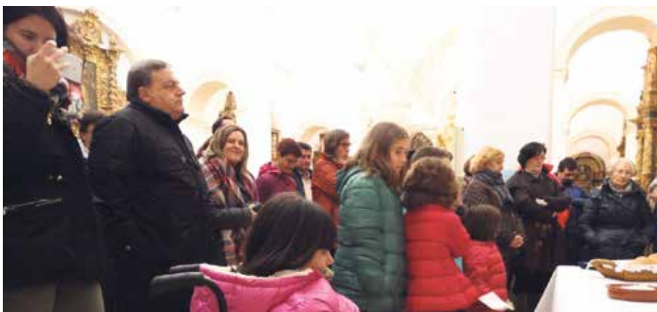
Cena del hambre celebrada en Calamocha, la próxima será en Alcorisa.

Manos Unidas continúa con su labor de sensibilización y de difusión de la 59 campaña del Hambre.