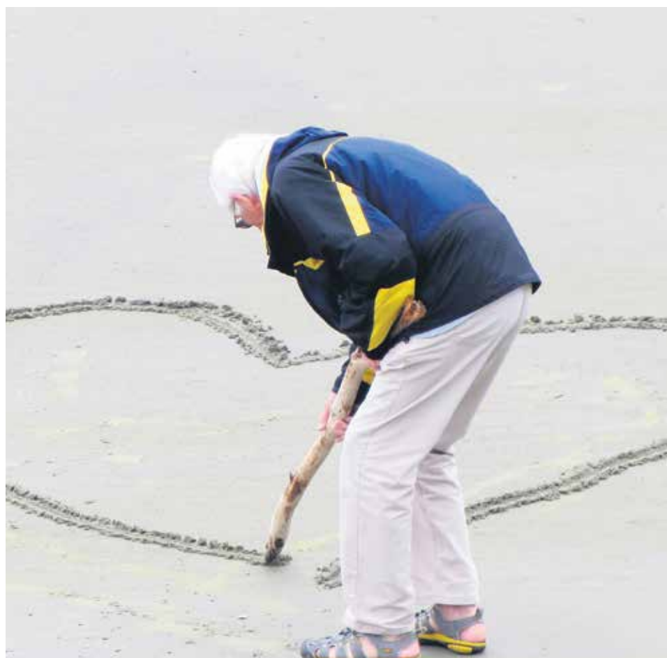
El apoyo de las familias ayuda a los enfermos a seguir hacia delante.

Zaragoza acoge el 24 de febrero el IV Encuentro anual de las delegaciones de Pastoral de la Salud de las diócesis aragonesas y de La Rioja. Un espacio donde abordar desde diferentes perspectivas y a través de diferentes ponencias la situación del enfermo y el papel de la familia ante la enfermedad. 'Necesidades humanas y espirituales de la familia en la enfermedad', 'El poder de las emociones' o 'David, la alegría de vivir' son algunos de los temas que conforman este encuentro de la pastoral de la Salud.