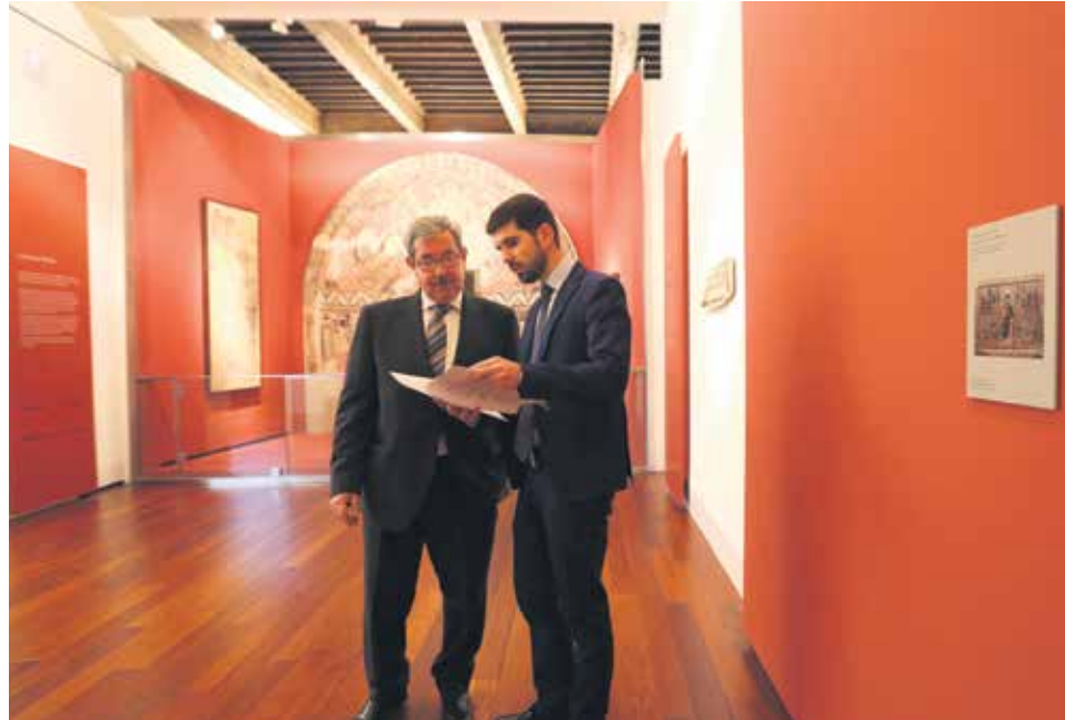
Barbastro está preparado para acoger los bienes.

La demanda quiere poner fin al litigio que se inició en 1995 con la modificación de los límites de las diócesis de Lérida y de Barbastro –a partir de entonces de Barbastro-Monzón–, lo que supuso un cambio en la situación patrimonial de bienes artísticos que habían sido trasladados desde diferentes parroquias hasta el Museo Diocesano de Lérida para su estudio y difusión. De acuerdo con el decreto "Ilerdensis-Barbastransis de finium mutatione", de 15 de junio de 1995, el patrimonio de las parroquias aragonesas transferidas de la diócesis de Lérida a la de Barbastro-Monzón