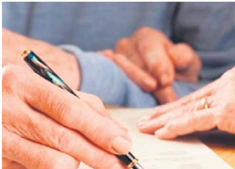
Es algo que todos deberíamos plantearnos, sabiendo que Dios es el mejor pagador.

Pero sí podemos hacer algo por ayudarla, en cualquiera de sus estructuras: diócesis, parroquias, fundaciones y asociaciones dependientes de ella. Algo tan simple como tenerla en cuenta a la hora de