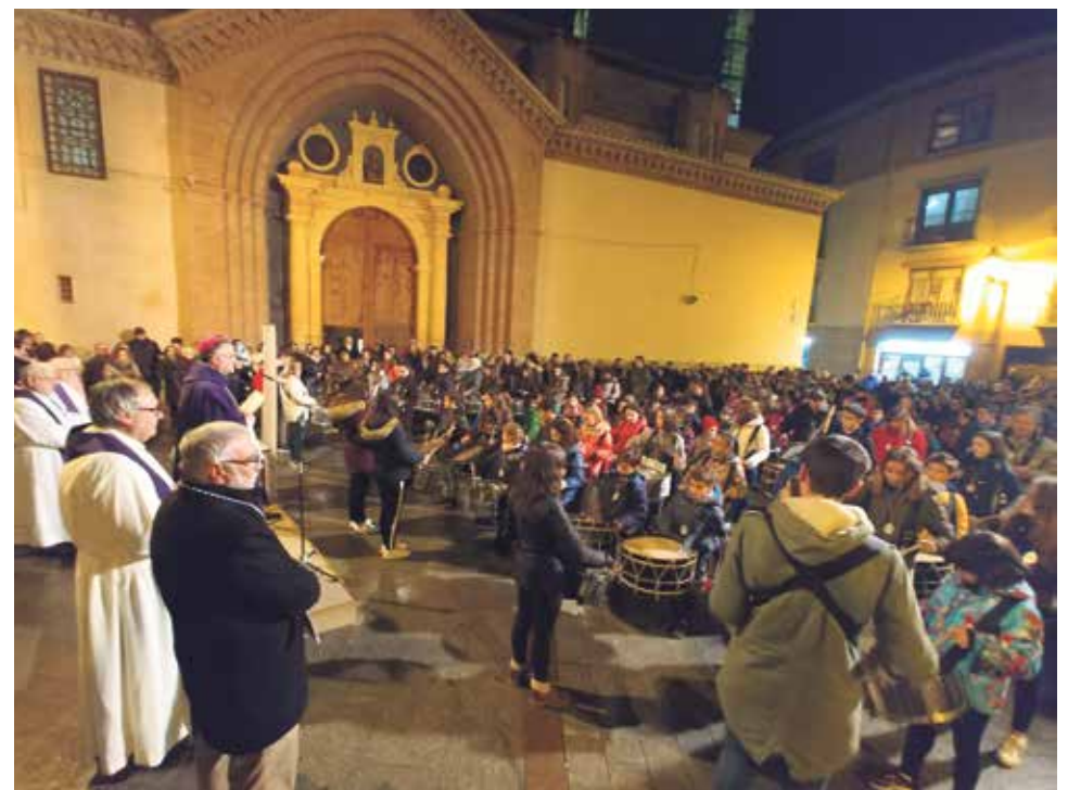
Las "cuadrillas" de la Semana Santa de Teruel reciben la ceniza.

El miércoles, 14 de febrero, se inició el camino hacia la Pascua con el signo y el gesto de la imposición de la Ceniza.