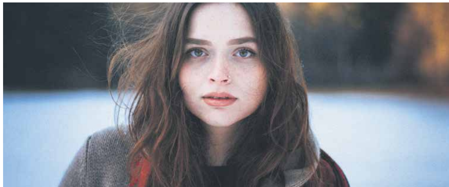
El joven vive la gran aventura de convertirse en adulto, y en ese proceso se juega la mayor toma de decisiones de su vida.

El joven vive la gran y difícil aventura de convertirse en adulto, de madurar, y en ese proceso se juega la mayor toma de decisiones de su vida. Unas decisiones que marcarán definitivamente su vida; unas decisiones en las que se juega su felicidad. En esta aventura de madurar y de responder a sus anhelos más profundos, Jesús se hace el encontradizo. En ese caminar de los jóvenes, en ese proceso de crecer, la Iglesia ha de descubrir la forma de hacerse la encontradiza por medio de verdaderos acompañantes que con respeto y libertad, con formación y entrega, con paciencia y tesón, con oración y acción sean capaces de interpelar al joven para descubrir el proyecto de Dios en su vida viviendo en clave de discernimiento.