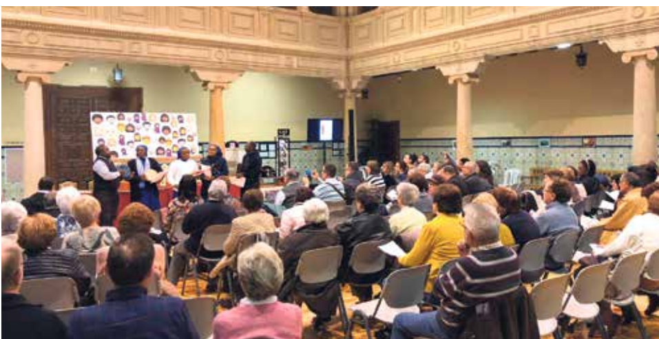
El viernes, 16 de noviembre, oración por los pobres en el obispado de Teruel.