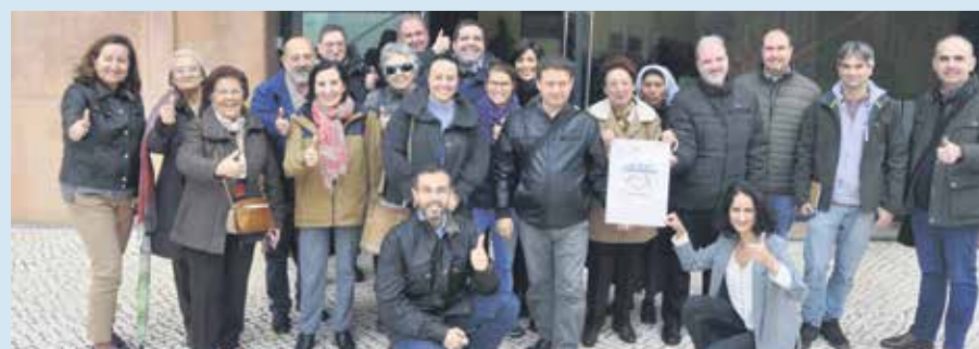
Los asistentes participaron activamente en la jornada.

Después de un descanso, llegó el turno de trabajo. La puesta en marcha