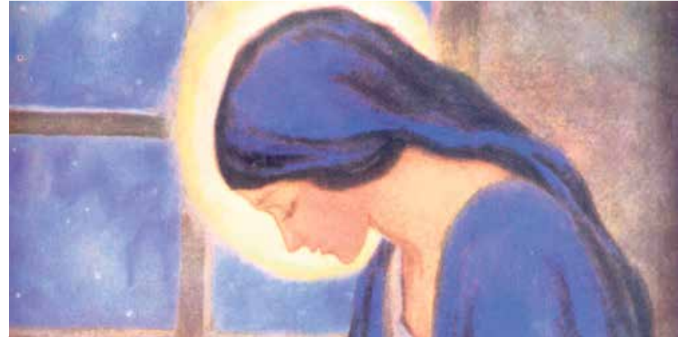
Cartel del retiro de Adviento de la Acción Católica General y la CONFER.