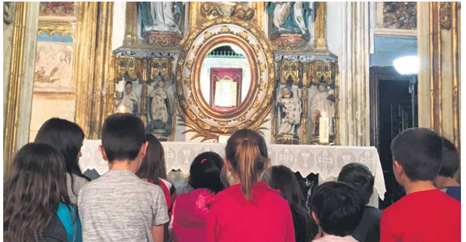
Los niños de Primera Comunión de la parroquia de Daroca rezan ante los Sagrados Corporales.

San Manuel González, gran apóstol de la eucaristía, no entendía un cristianismo sin eucaristía y sin sagrarios acompañados. Él pensaba que la semilla de la fe nacía y maduraba a la luz de la lámpara del sagrario y que nuestro ser apóstoles era un ir y venir del sagrario al prójimo. Estas intuiciones, recogidas en sus obras y en su espiritualidad, están también contempladas en el magisterio de la Iglesia.