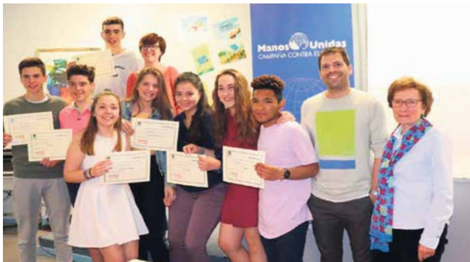
Alumnos del colegio La Salle que participaron en el concurso de Clipmetrajes.

El pasado jueves, 10 de mayo, se realizó la entrega de diplomas a los alumnos del colegio La Salle que participaron en el concurso del Clipmetrajes de este año que lleva por título “¿Cuál es tu receta para luchar contra el hambre?” Bajo este lema alrededor de 100 alumnos del colegio La Salle hicieron 7 vídeos de un minuto en el que mostraron su interpretación del tema.