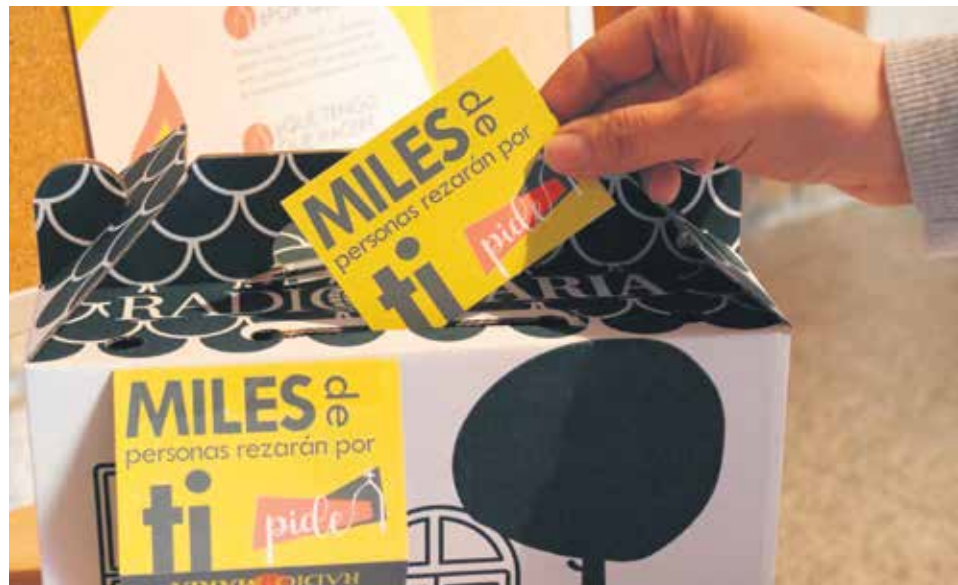
Quien lo desee puede depositar en estas casas-buzón sus peticiones a Dios.

La profundización en la vida de oración se hace especialmente a través de los diferentes programas de la radio