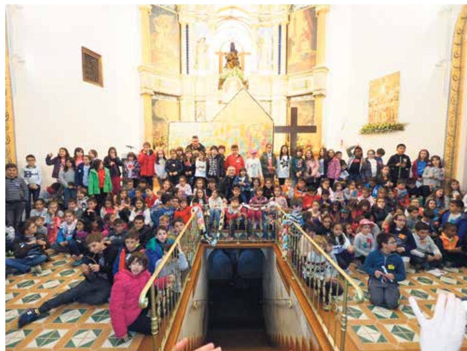
Unos 200 niños participaron en el Encuentro Diocesano de Primera Comunión.

En nuestra web diocesana pueden ver todas las fotos del encuentro realizadas por el Padre Mercedario Fernando Ruíz Valero.