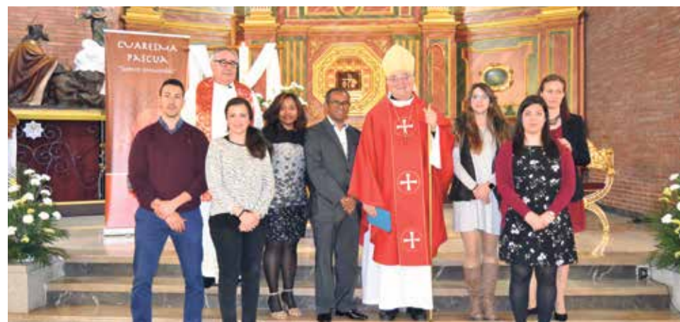
Siete adultos fueron confirmados por el Sr. Obispo en San León.

El viernes 13 de abril del presente año tuvo lugar la confirmación de siete adultos en la Parroquia de San León.