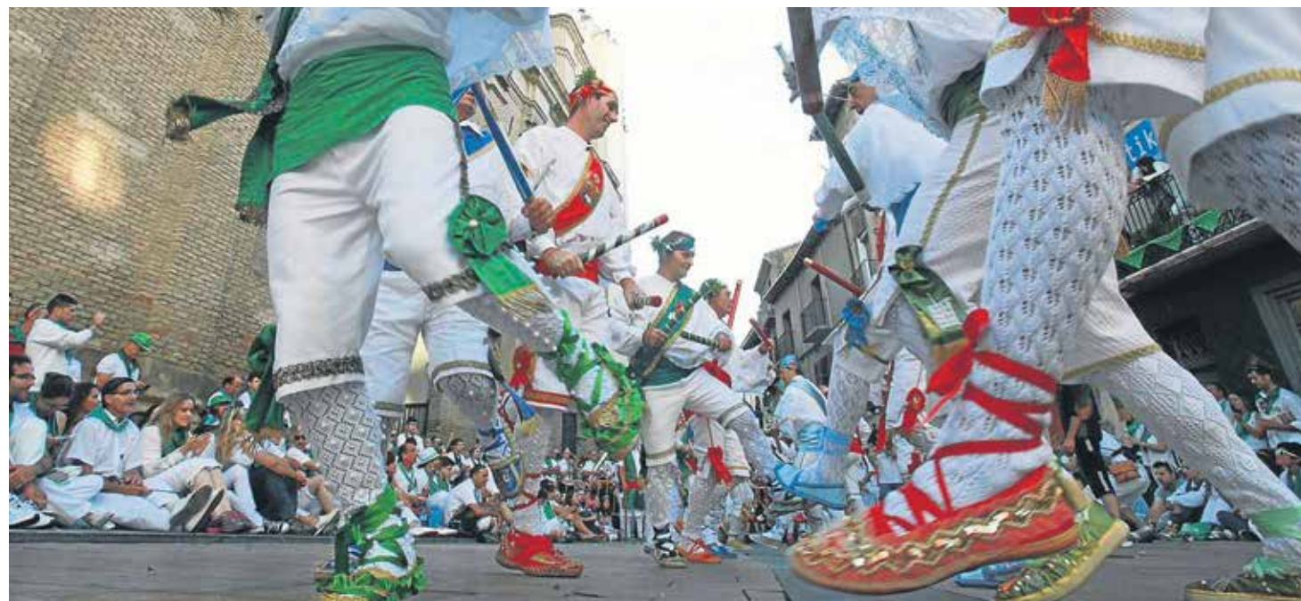
El dance de San Lorenzo es una expresión genuina de religiosidad popular.

Asimismo, fue arcediano o primer diácono del papa san Sixto II , quien le encomendó la administración de los bienes, los cementerios, limosnas, rentas y custodia de los archivos. Su entereza durante una muerte muy cruenta se representa en una frase pronunciada por san Lorenzo durante estos tormentos: "Ya estoy asado por este lado; da vuelta y come". Murió