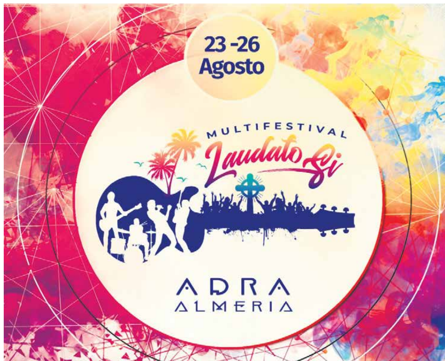
El Multifestival Laudato Si cierra el ciclo de festivales de música católica en verano.

Otro festival en Francia, muy relacionado con nuestro país, es