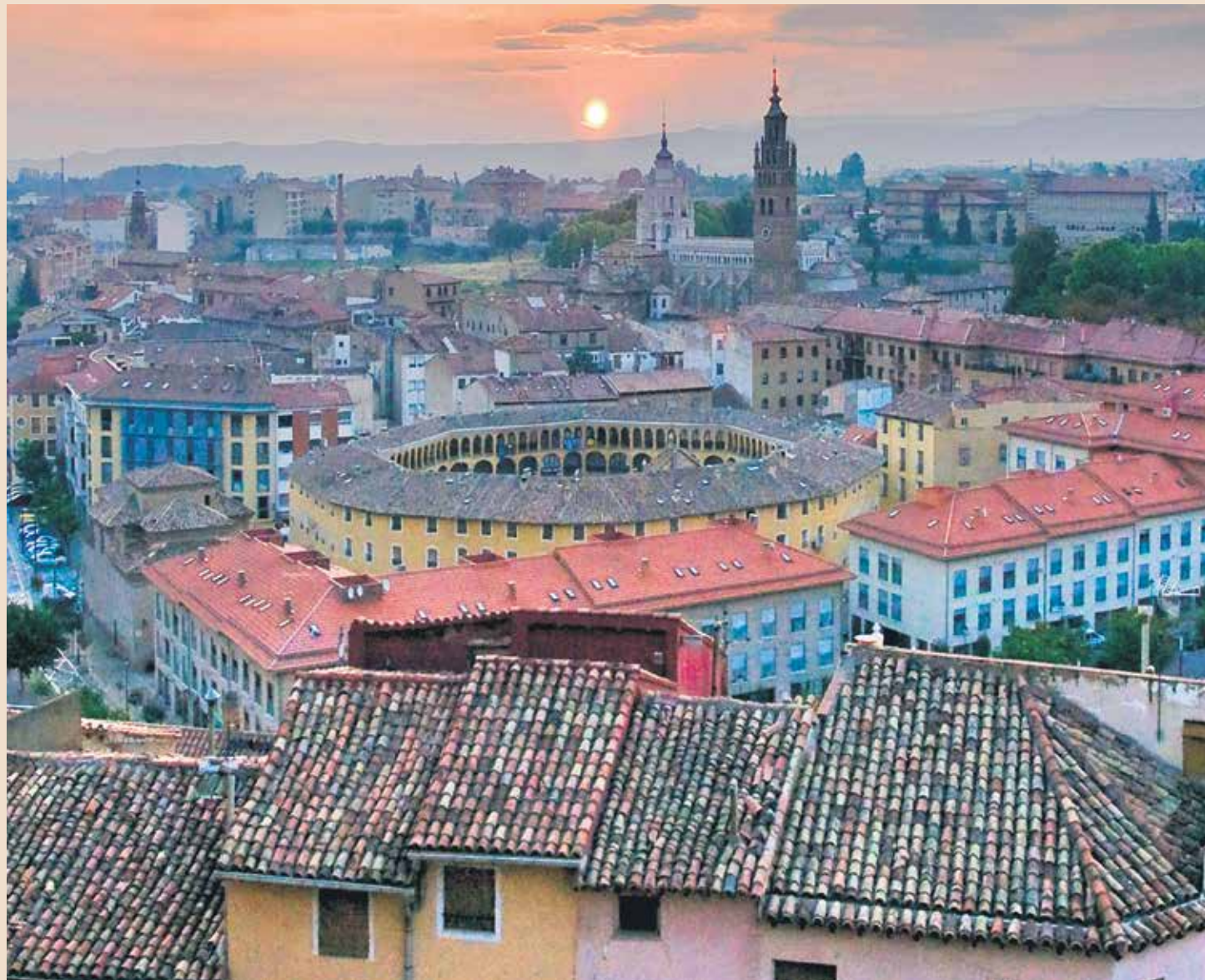
Panorámica de la ciudad de Tarazona con su catedral al fondo

Por fin, llegamos a Teruel en donde adquiere el arte mudéjar